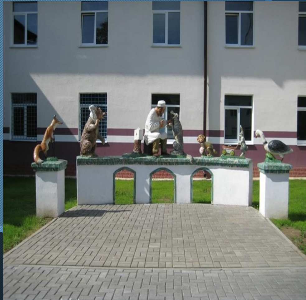
Скульптура Доктора Айболита м. Воложин, Білорусь