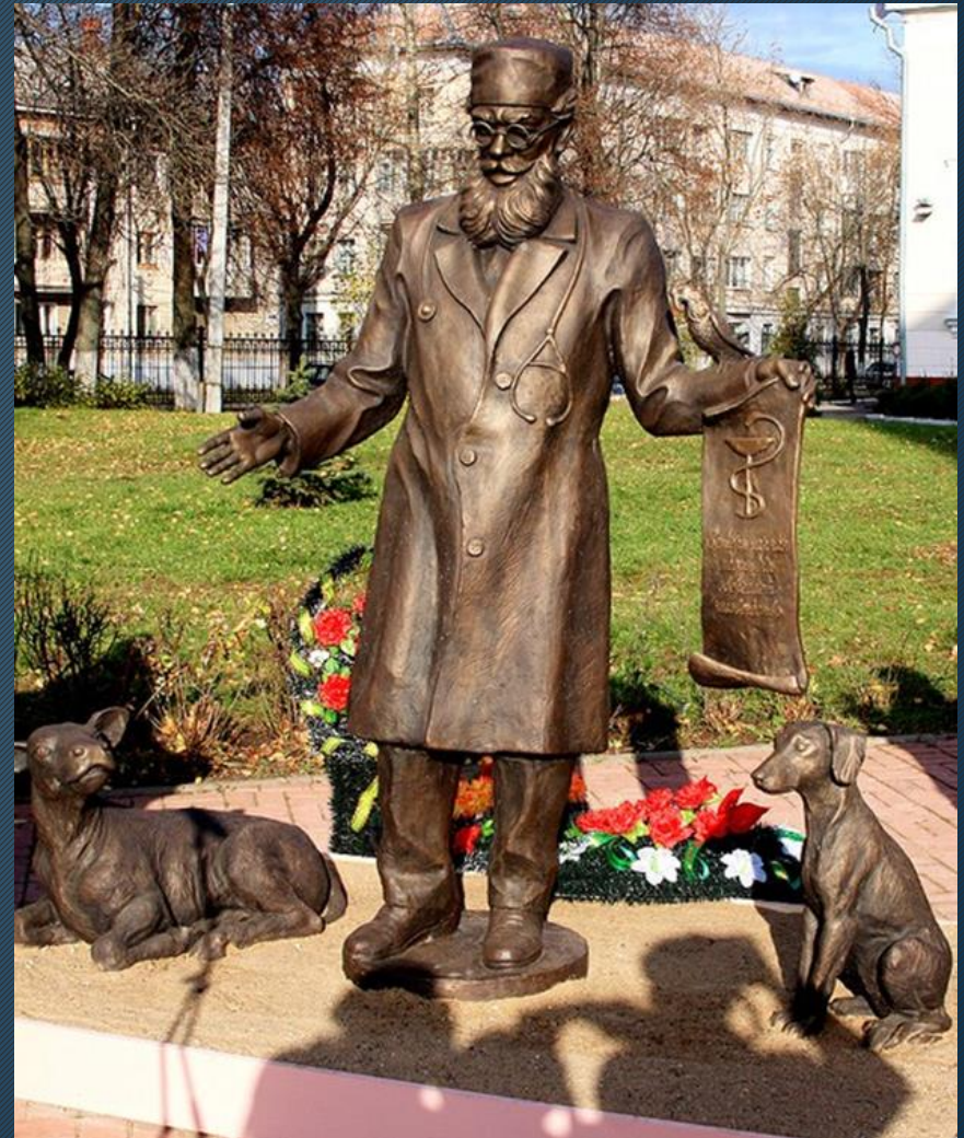
Скульптура Доктора Айболита м. Вітебськ, Білорусь