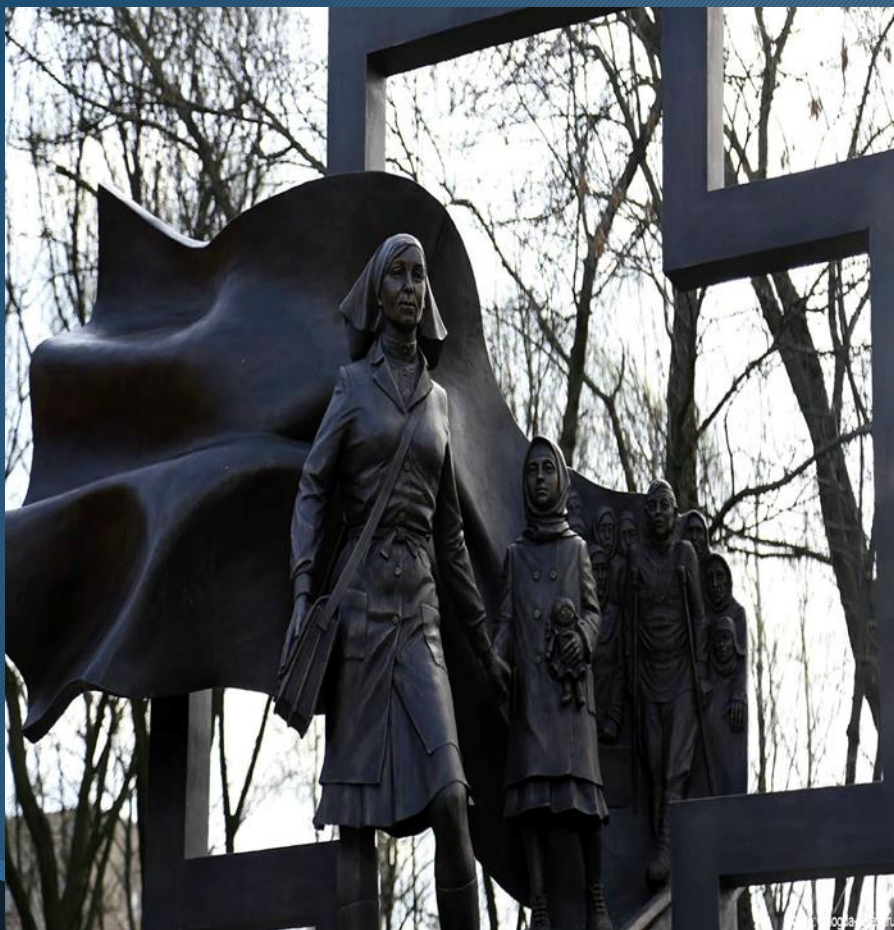
Пам'ятник Медсестрі м. Череповець, Росія

В час, коли життя на волосині, і, здається, зірка вниз летить, ти довірся лікарю, людиню, - від біди тебе він захистить. Ти довірся тим рукам умілим, що творити можуть чудеса, людям, що любов'ю й словом щирим повертають зорі в небеса.