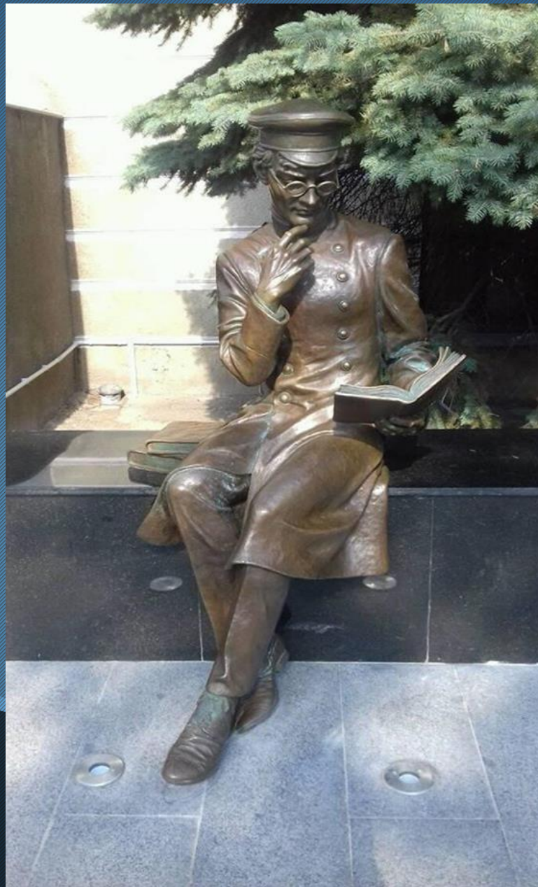
Студент – медик. 19 століття.