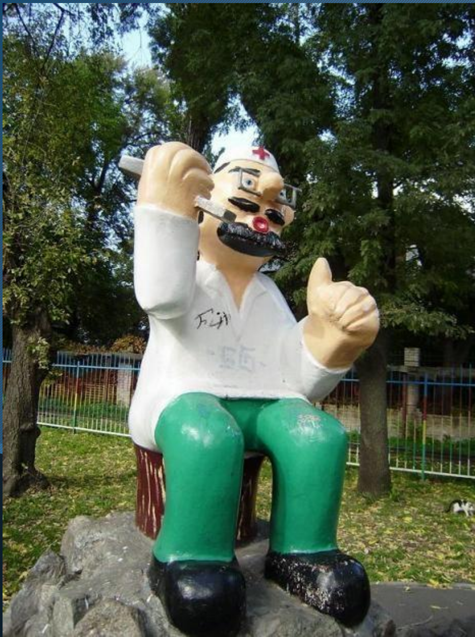
Скульптура Доктора Айболита м. Дніпро, Україна