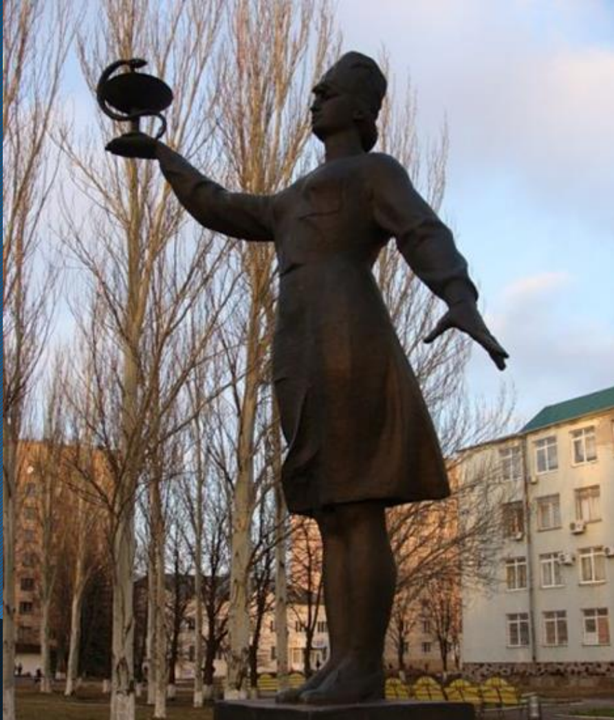
Пам'ятник лікарю м. Луганськ, Україна