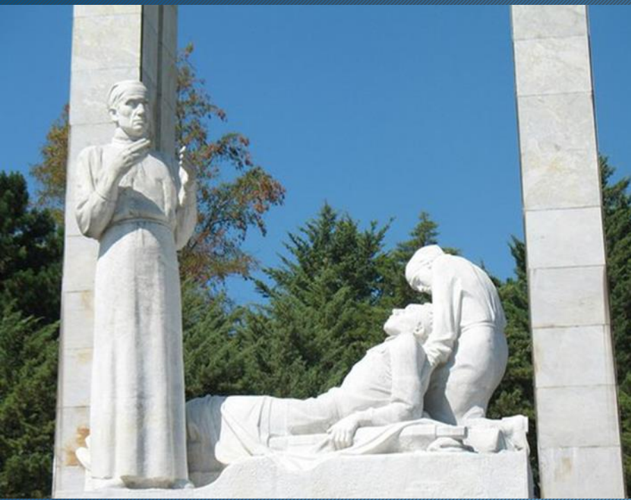
Пам'ятник фронтовому хірургові м. Калуга, Росія