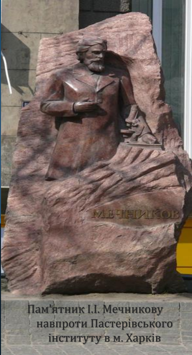
Пам'ятник І.І. Мечникову навпроти Пастерівського інституту в м. Харків