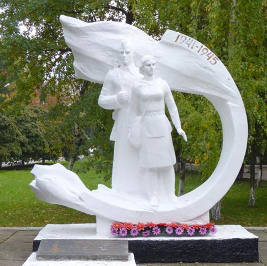
Пам'ятник воїнам-медикам Полтавської психіатричної лікарні, загиблим в роки Великої Вітчизняної війни м. Полтава, Україна

Пам'ятник викладачам, студентам і співробітникам Донецького медичного інституту м. Донецьк, Україна Пам'ятник встановлено 8 травня 1970 року на кошти зібрані викладачами, співробітниками і студентами медичного університету