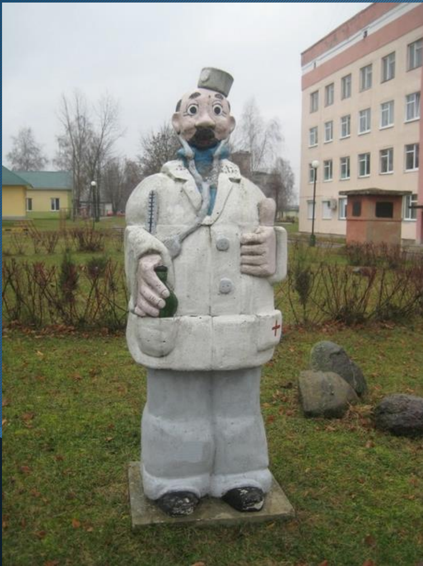
Скульптура Доктора Айболита м. Бердянськ, Україна