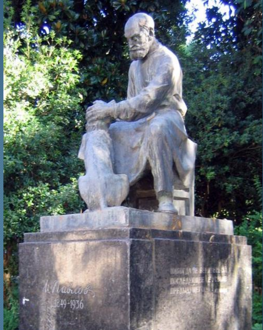
Пам'ятник академіку І.П. Павлову з собакою. Встановлений у 1969 році в Сухумі на території Інституту експериментальної патології і терапії (скульптор А. Рябічева, архітектор Ф. Андрєєва).