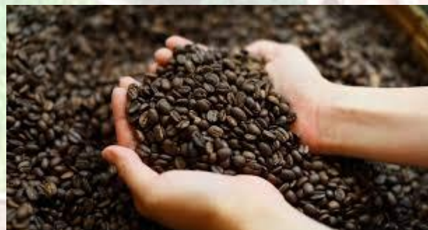
День кавових зерен