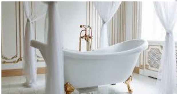
Міжнародний день ванни (лазні)