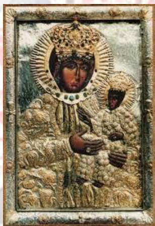
Свято ікони Божої Матері "Животодательниця"