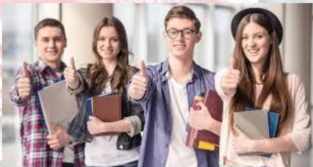
День державної служби ООН

23 ЧЕРВНЯ - ДЕНЬ ДЕРЖАВНОЇ СЛУЖБИ В УКРАЇНІ