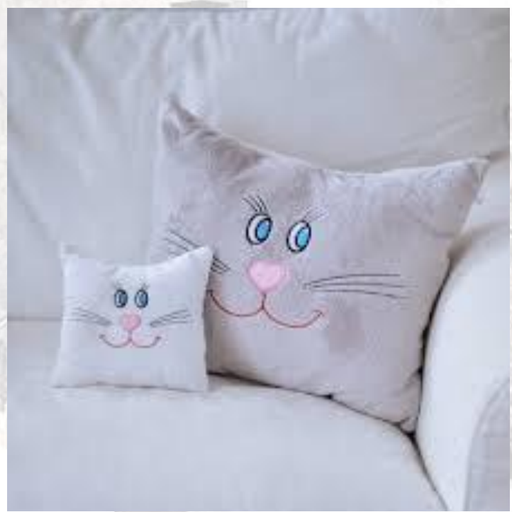
День м'яких подушок