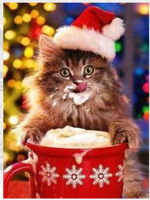
Котячий Новий рік