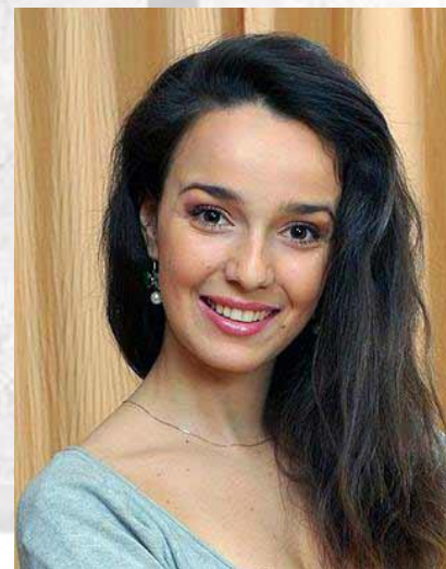
Актриса театру і кіно Валерія Ланська (1987)