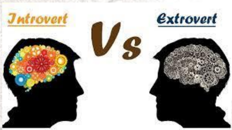
Всесвітній день інтроверта