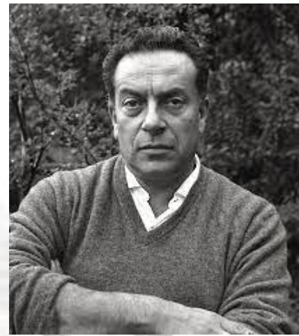
Живописець і графік Ренато ГУТТУЗО (Італія, 1912-1987)