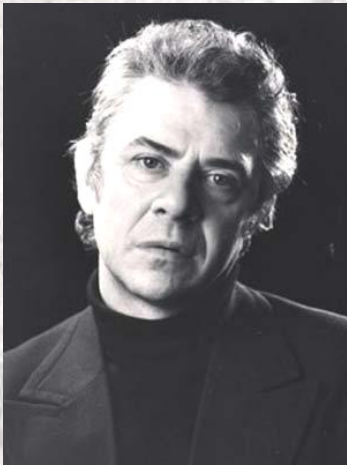
Артист естради, виступав у дуеті з Романом Карцевим (1937-1992)