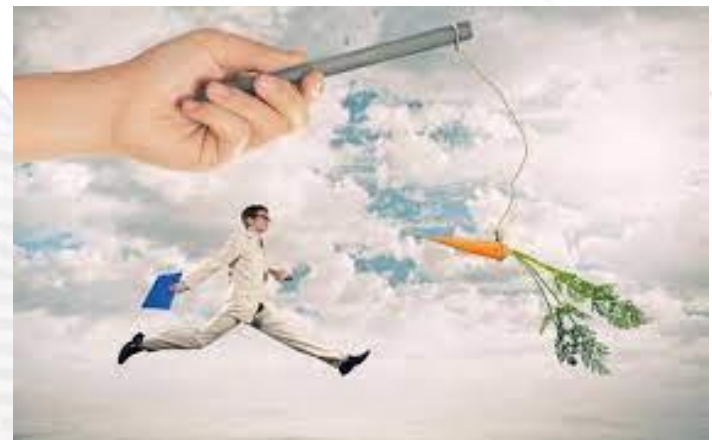
День мотивації і натхнення