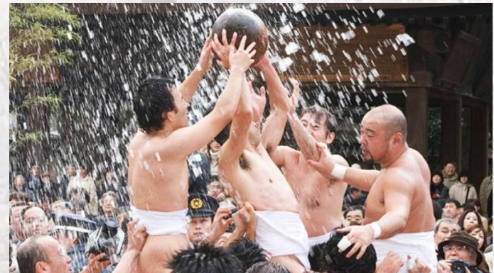
Фестиваль Тамасесері (Японія)