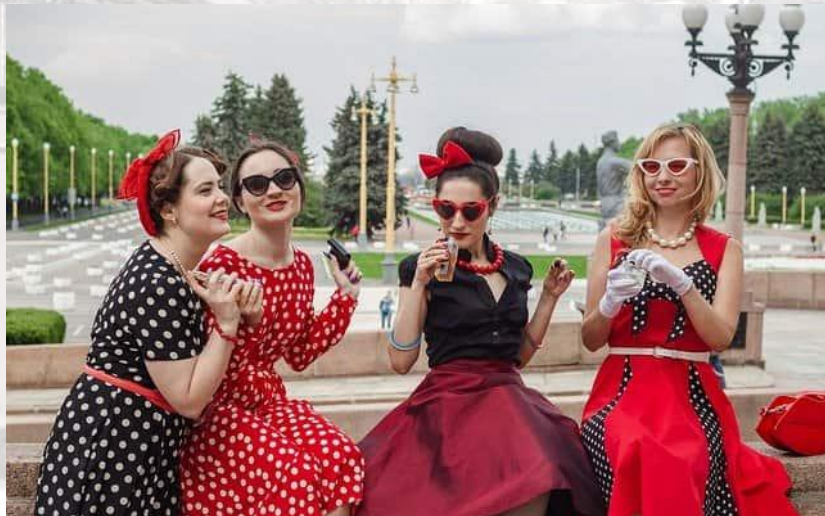
День жінок у рок-н-ролі