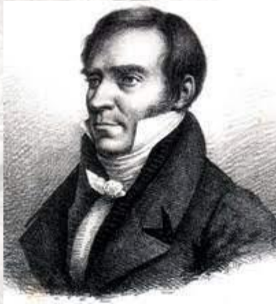
Математик і механік, академік Луї Пуансо (Франція, 1777-1859)