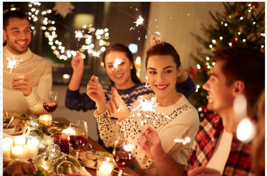
День бенгальських іскор та гірляндних вогнів