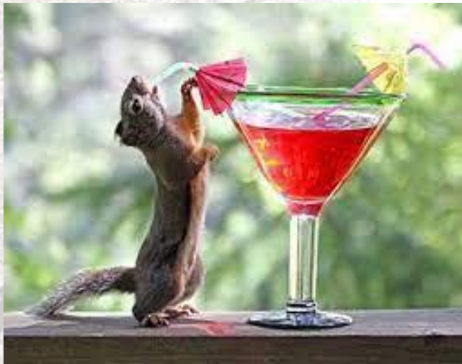
День соломинки для коктейлів