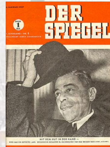
Вийшов перший номер західнонімецького журналу "Der Spiegel". Коштував 1 марку (1947)