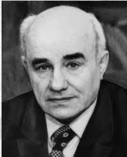
Генетик, професор, академік Микола Дубінін (1907-1988)