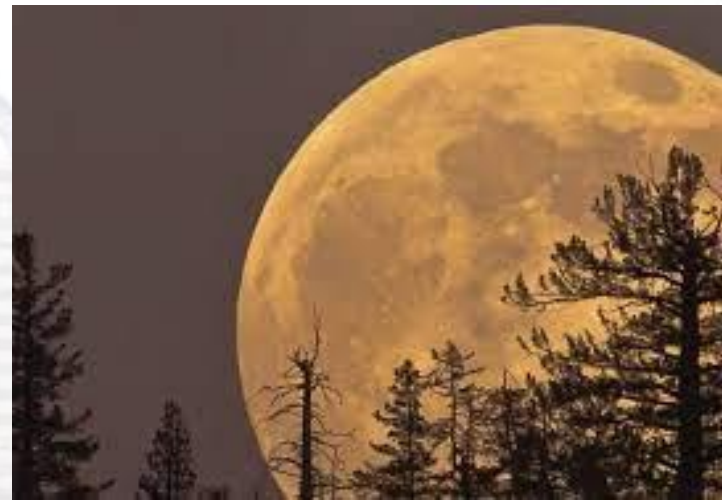
Місяць опинився на найкоротшій відстані від Землі в ХХ-му сторіччі (348 249 км) (1912)