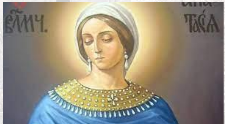
День пам'яті святої Анастасії