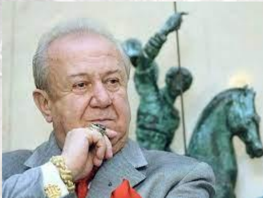
Живописець, скульптор, дизайнер, педагог Зураб Церетлі (Грузія, 1934)