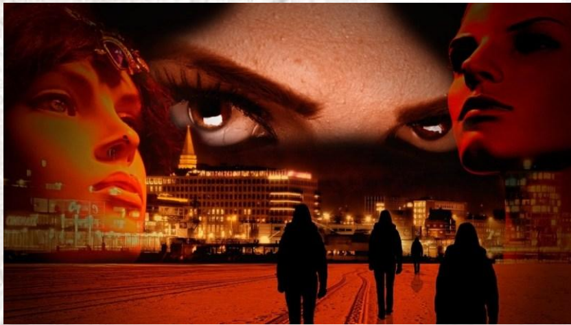
Всесвітній день гіпнозу