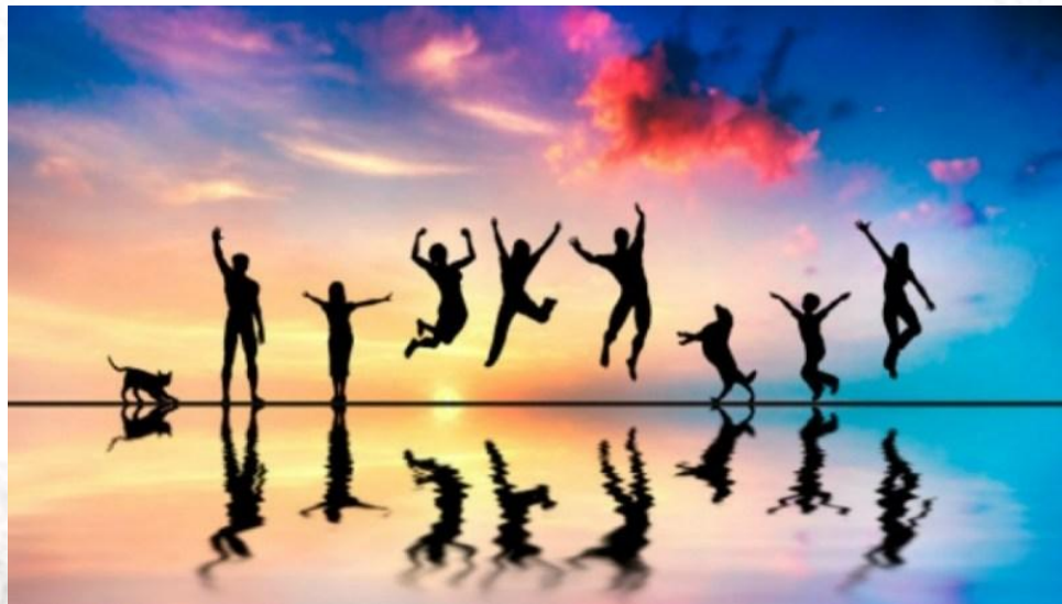
День поширення мікробів радості