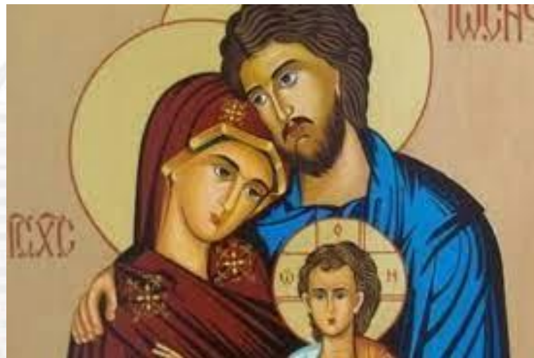
Собор Пресвятої Богородиці