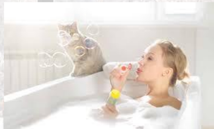
День ванни з піною (США)