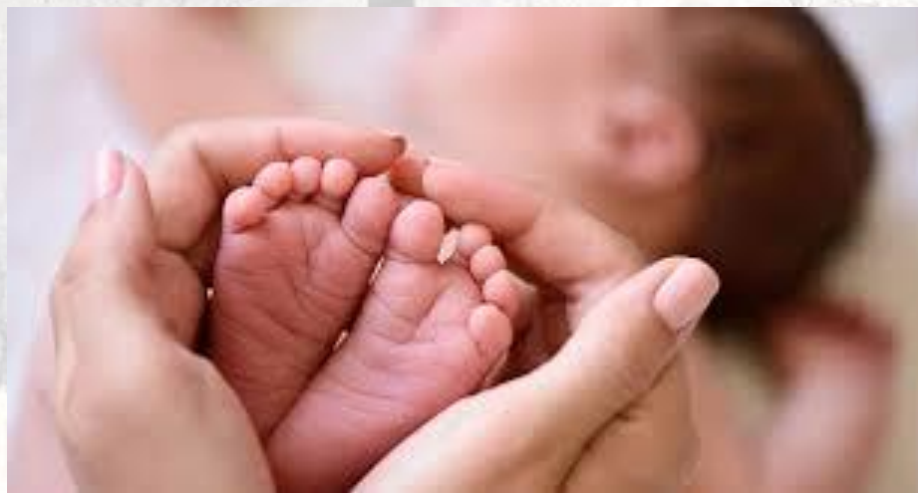
День повитух (Бабині каші)