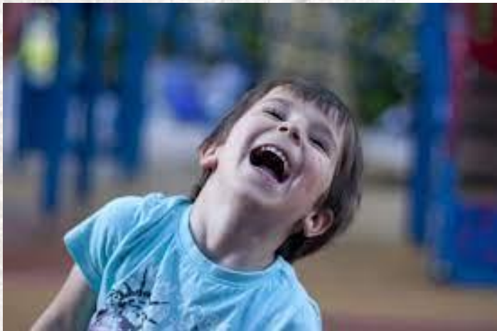
День заразливого сміху