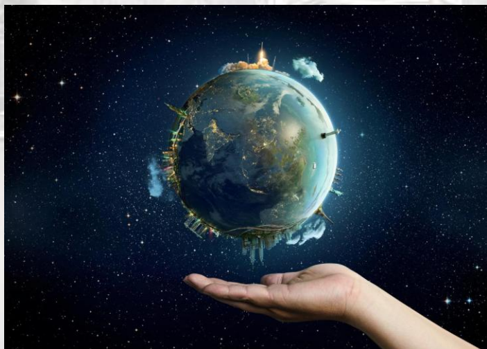
День обертання Землі