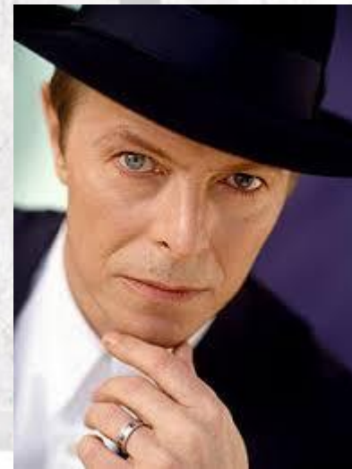
Рок-музикант-мультиінструменталіст, співак, продюсер, аудіо-інженер, композитор, художник, кіноактор Девід Боуї (Англія, 1947)