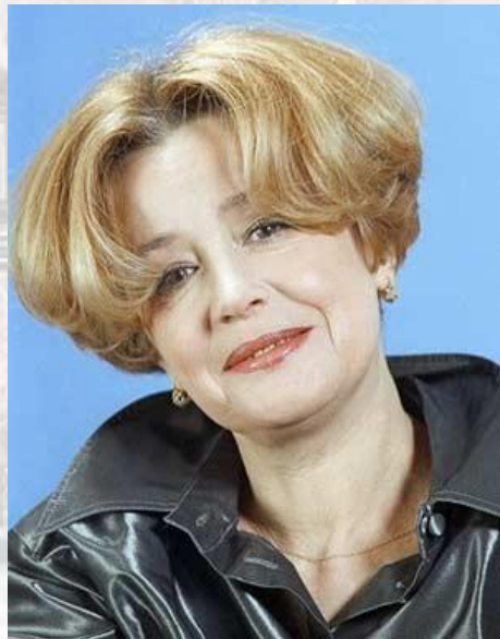
Акторка театру й кіно Марина Нейолова (1947)