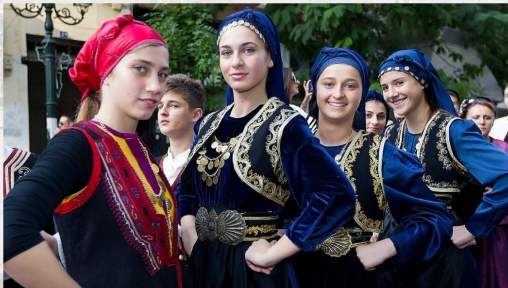
Фестиваль жінок (Гінайкратія, Греція)