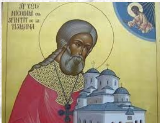
День пам'яті преподобного Никодима Тисманського