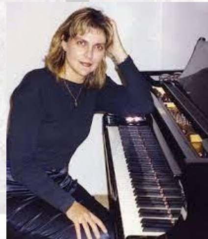
Композиторка Людмила Юріна (1962)