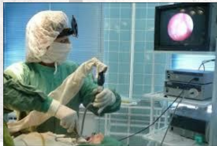
День «Без скальпеля» (США)