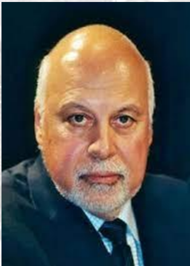
Музикант, продюсер, чоловік Селін Діон Рене Анжелін (США, 1942-2016)