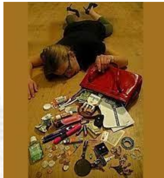
День великих сумкових розкопок