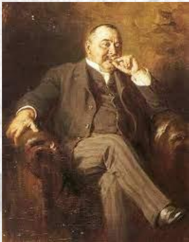
Письменник Кальман Мікшат (Угорщина, 1847 – 1910)