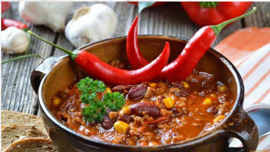
Міжнародний день гострої та гарячої їжі