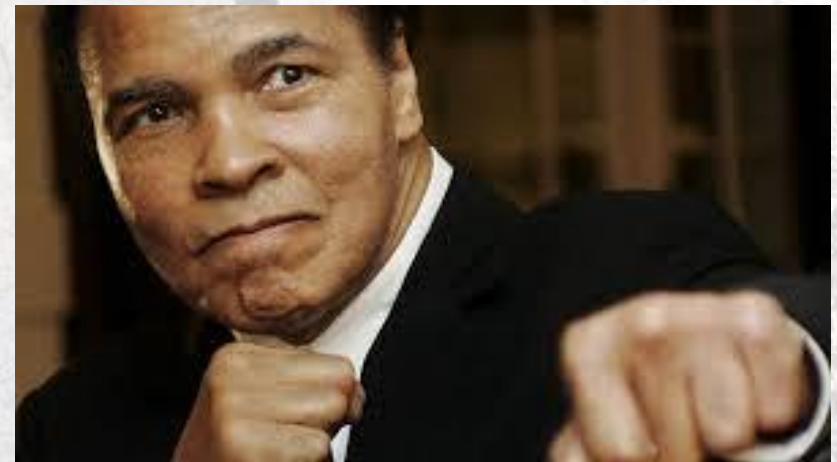
Боксер, чемпіон Олімпіади 1960 у напівважкій вазі, він став чемпіоном світу серед професіоналів у важкій вазі в 1964, єдиний хто вигравав цей титул тричі Мухамед Алі (США, 1942-2016)