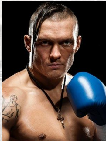
Професійний боксер Олександр Усик (1987)