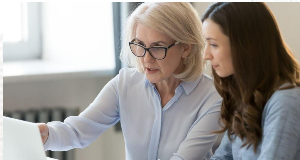
Міжнародний день наставництва