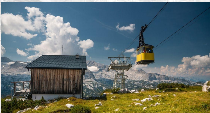
День канатної дороги