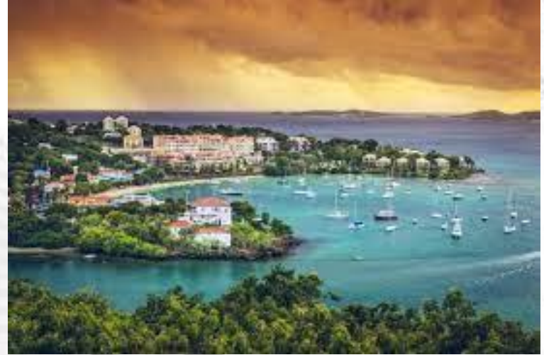
США придбали в Данії за 25 млн. доларів Віргінські острови (1917)