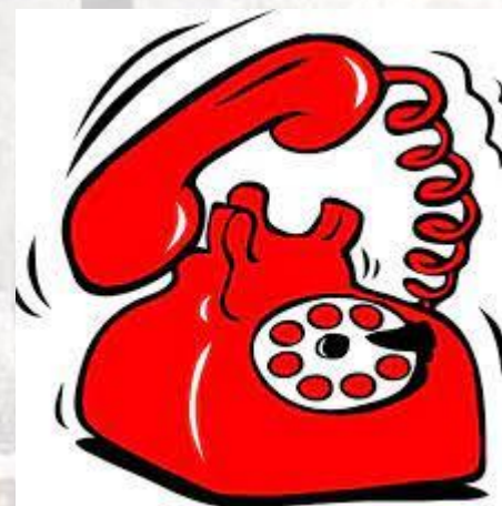
День задобріння телефонного божества