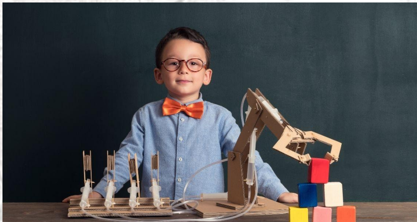
День дитячих винаходів (День творчості і натхнення)