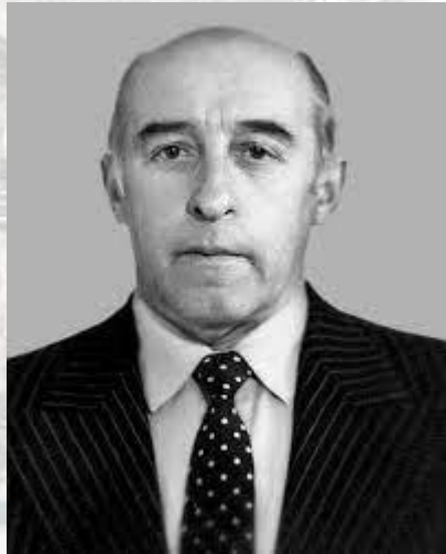
Санітарний лікар, професор Юрій Думанський (1932)