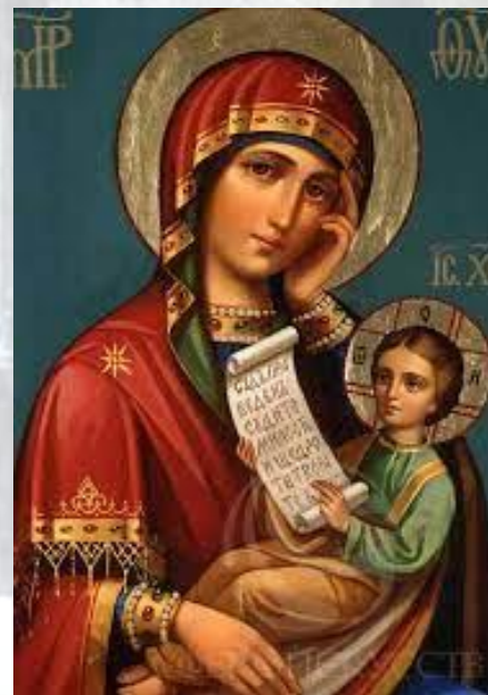
Свято ікони Божої Матері «Утамуй мої печалі»