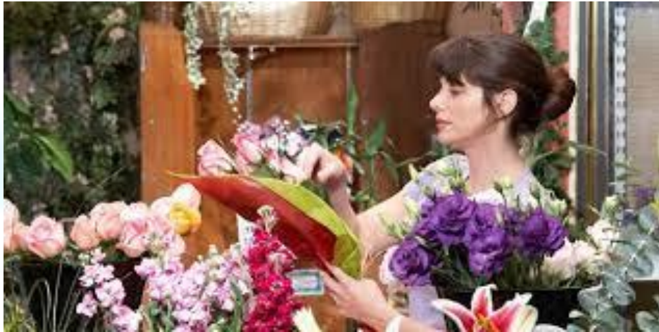
День флориста України