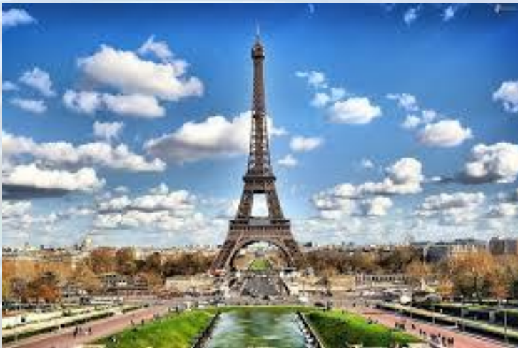
День Ейфелевої вежі