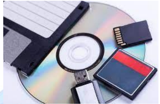
Міжнародний день резервного копіювання