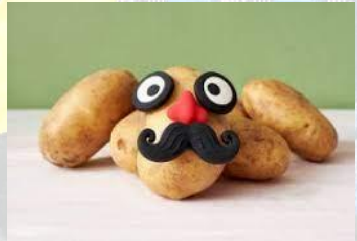
Національний день картоплини (США)