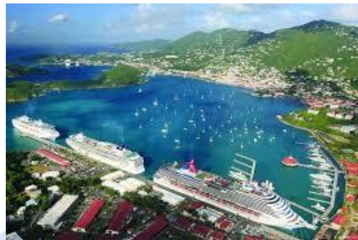
США купили у Данії Віргінські острови за 25 млн. доларів (1917)