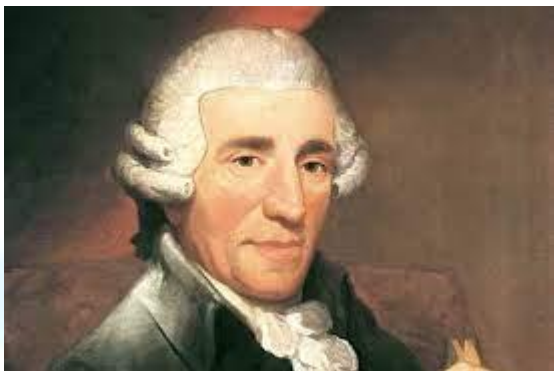
Композитор Франц Йозеф Гайдн (Австрія, 1732-1809)