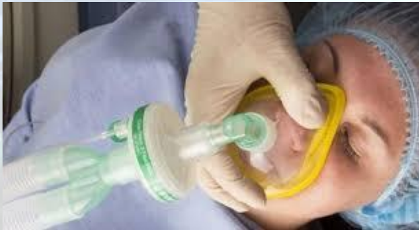
День анестезіолога - США