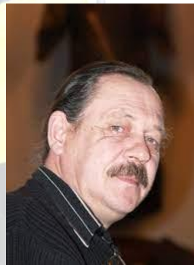
Письменник-новеліст і кінодраматург Василь Портяк (1952)