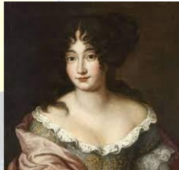
Міжнародний день декольте