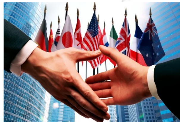
Міжнародний день багатосторонності і дипломатії заради миру