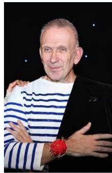
Модельєр Жан-Поль Готьє (Франція, 1952)