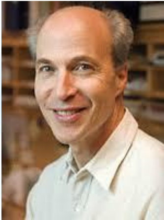
Біоімік, Нобелівський лауреат 2006 року Роджер Корнберг (США, 1947)