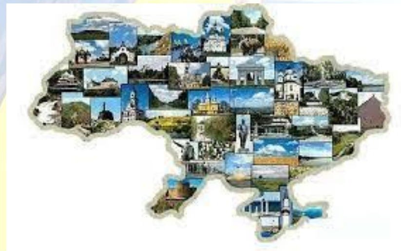
Всесвітній день поріднених міст

24 КВІТНЯ МІЖНАРОДНИЙ ДЕНЬ СОЛІДАРНОСТІ МОЛОДІ