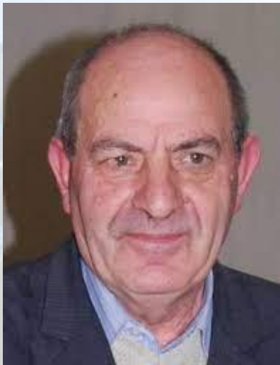
Письменник, філолог, професор Віталій Мацько (1952)