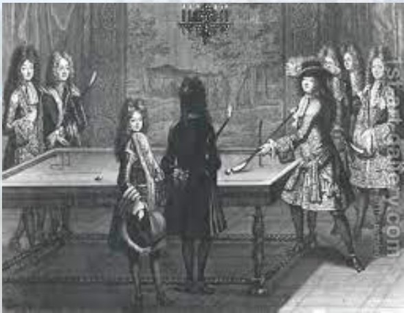
У газеті «New England Courant» вперше згадана гра більярд(1722)