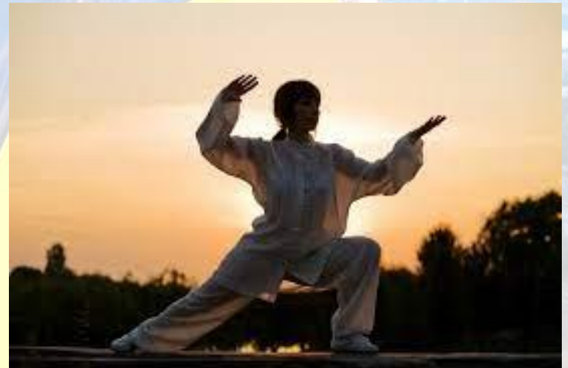
Всесвітній день тай-цзи і цигун