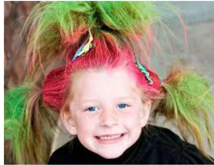
День зачіски, або День вдячності перукарям