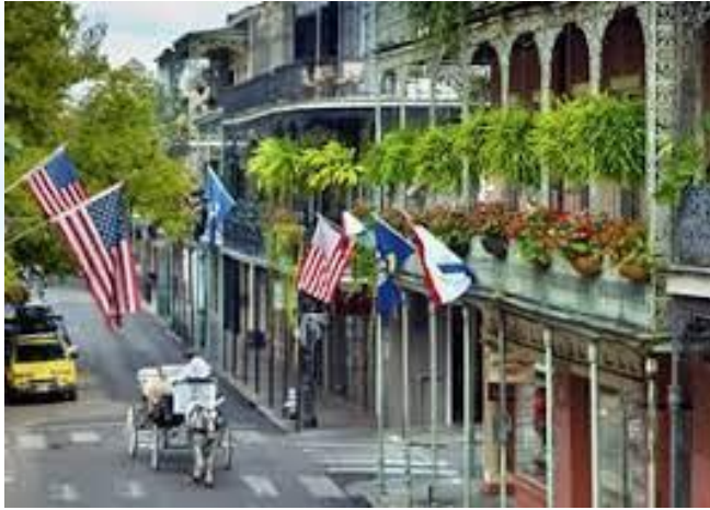
Луїзіана стала 18-м штатом США (1812)