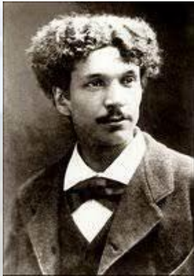
Винахідник, письменник і поет Шарль Кро передав Академії наук опис першого грамофона. Фактично, саме його слід вважати винахідником грамзапису, хоча Академія наук і не затвердила винахід Кро (Франція, 1877)