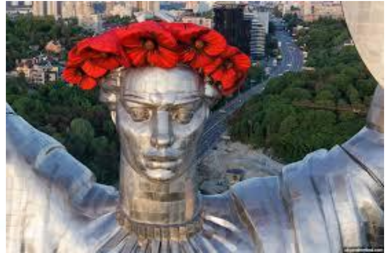
Міжнародний день скульптури