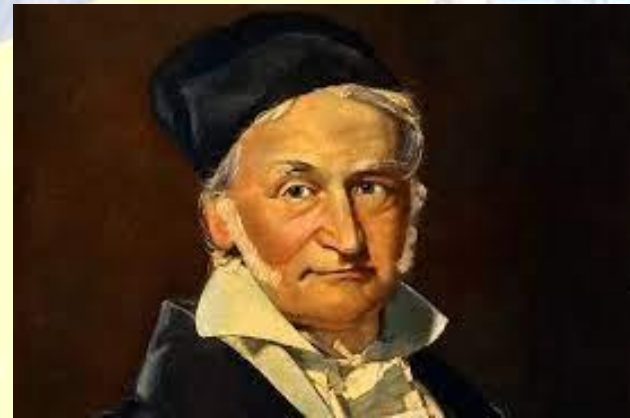
Видатний математик, астроном і фізик Карл Фрідріх Гаусс (Німеччина, 1777-1855)