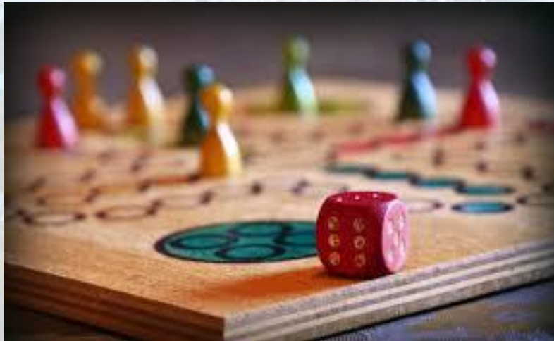
Міжнародний день настільних ігор