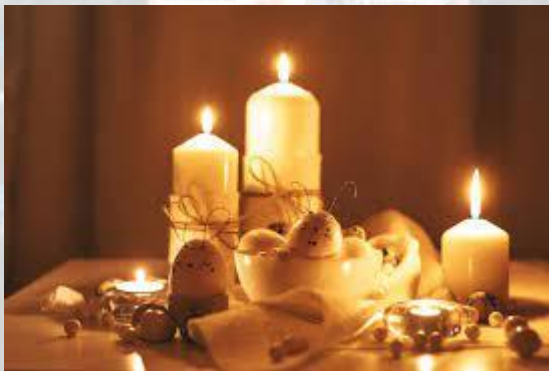
Міжнародний день свічкаря