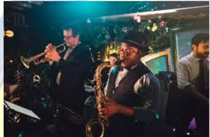
Міжнародний день джазу