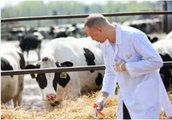
Міжнародний день ветеринарного лікаря