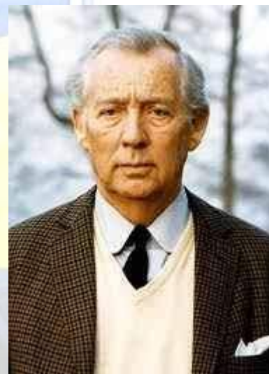
Видавець, засновник одного з найбільших у Європі видавничих концернів Аксель Шпрінгер (Німеччина, 1912- 1985)