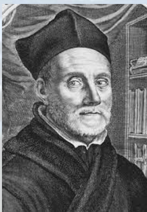
Учений-енциклопедист і винахідник, священник-єзуїт Атанасій Кірхер (Німеччина, 1602-1680)