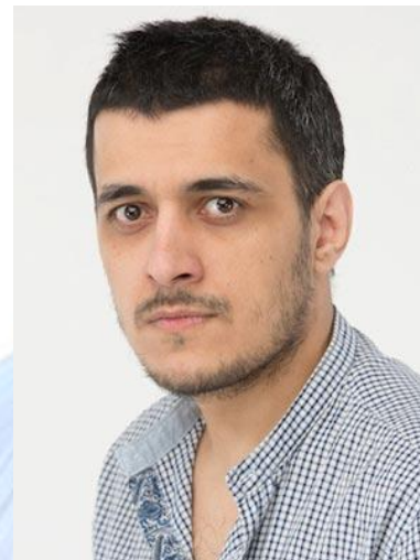
Актор, шоумен, телеведучий Едуард Мацаберідзе (1982)