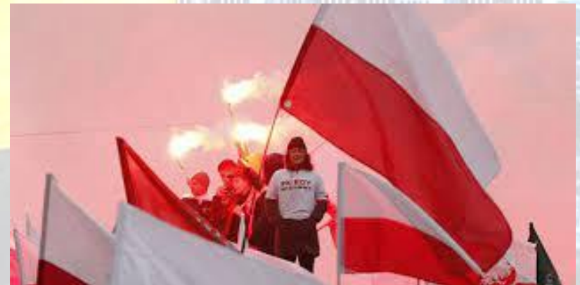
День прапора (Польща)