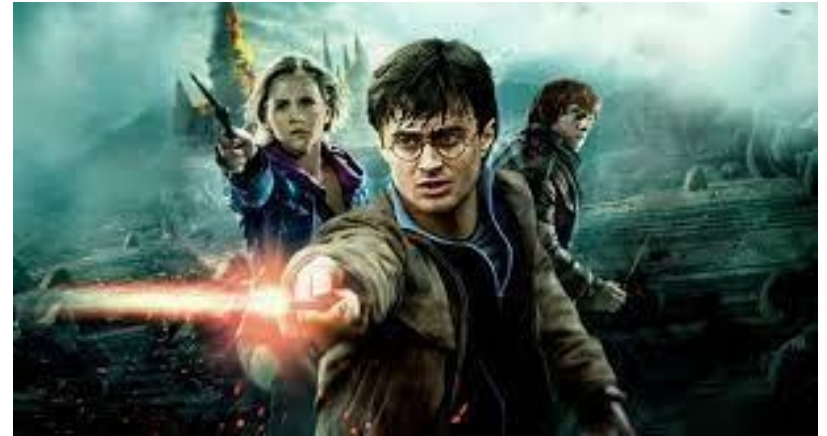
Міжнародний день Гаррі Поттера