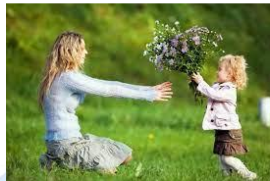
День матері (Литва, Іспанія, Румунія, Португалія, Угорщина)