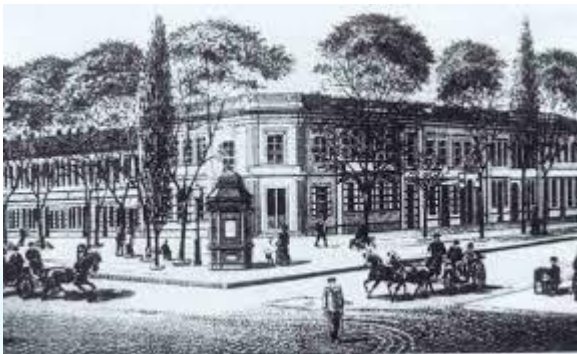
В Одесі заснували Рішельєвський ліцей (1817)