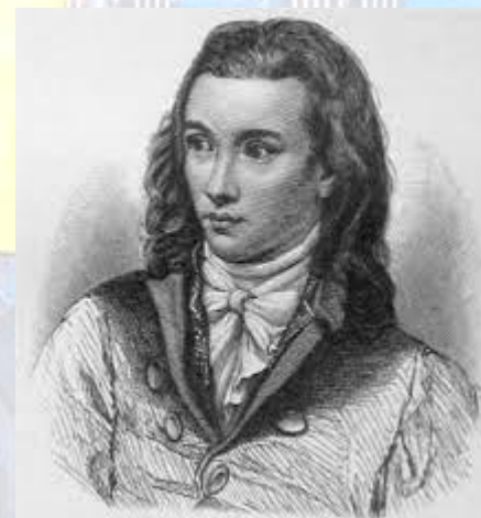
Поет-романтик, філософ-езотерик Новаліс (Фрідріх фон Гарденберг) (Німеччина, 1772-1828)