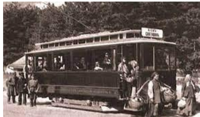
В Києві запущений перший електричний трамвай (1857)