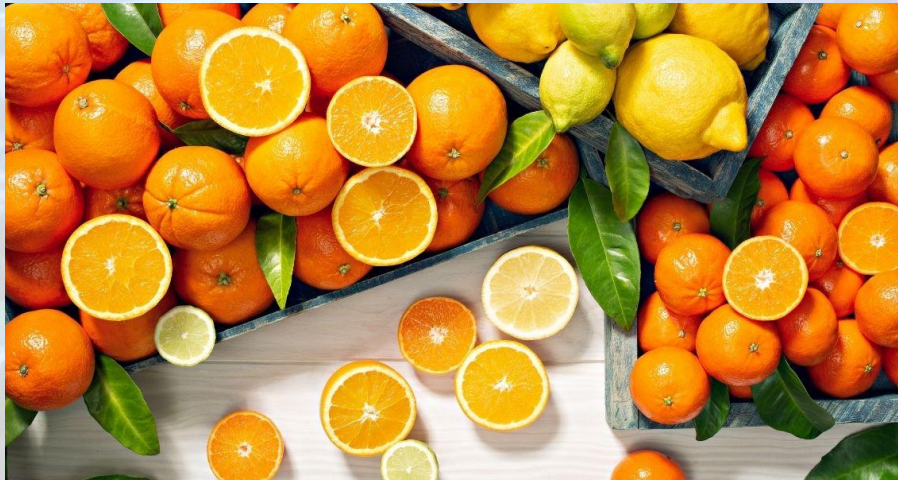
Міжнародний день поінформованості про цингу