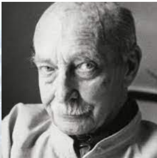
Письменник, автор численних оповідань, роману «Які прекрасні твої ніжки», нарисів, книг для дітей Алан Маршалл (Австралія, 1902- 1984)