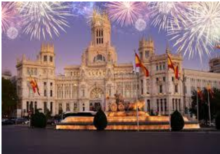
День Мадрида (Іспанія)