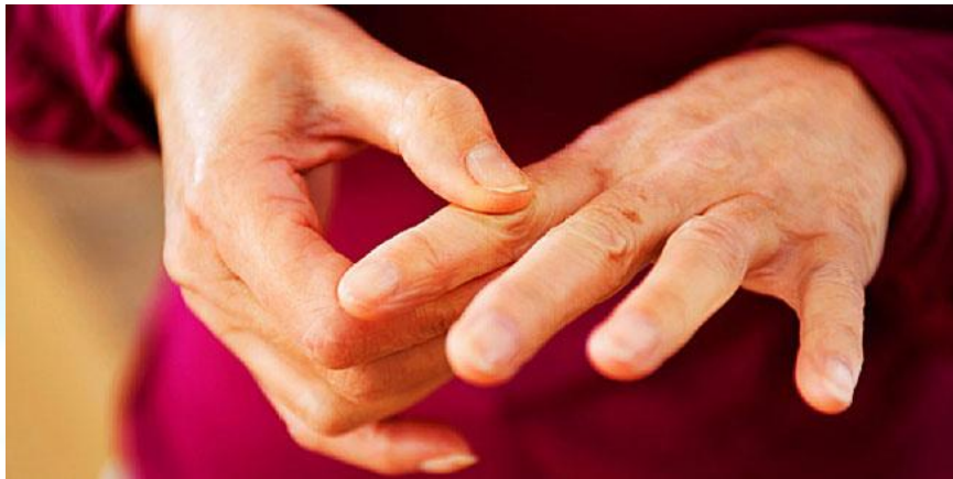
Всесвітній день боротьби з системною червоною вовчанкою