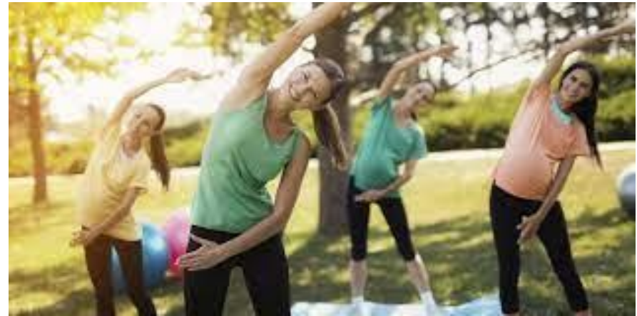
Всесвітній день руху для здоров'я