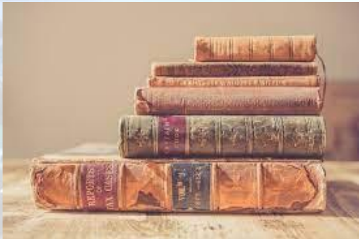
День книги (Німеччина)