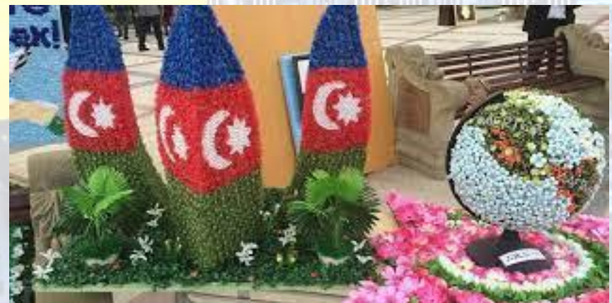
Свято квітів (Азербайджан)