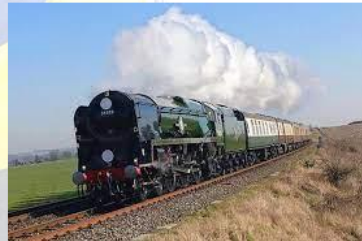
Останній рейс знаменитого «Східного експресу», яким із 1883 р. відправлялися мандрівники за маршрутом Париж-Стамбул(1977)