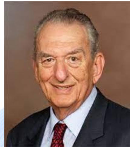
Хімік, Нобелівський лауреат 1994 року Джордж Ола (США, 1927-2017)