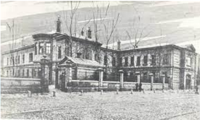
У Києві відбувся Перший всеукраїнський з'їзд акушерів та гінекологів(1927)