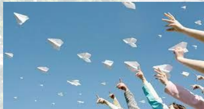
День запуску паперових зміїв і літачків