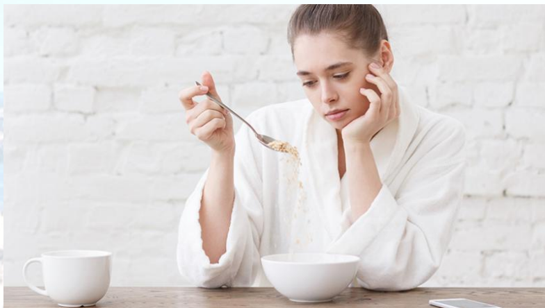
Всесвітній день боротьби з розладами харчової поведінки