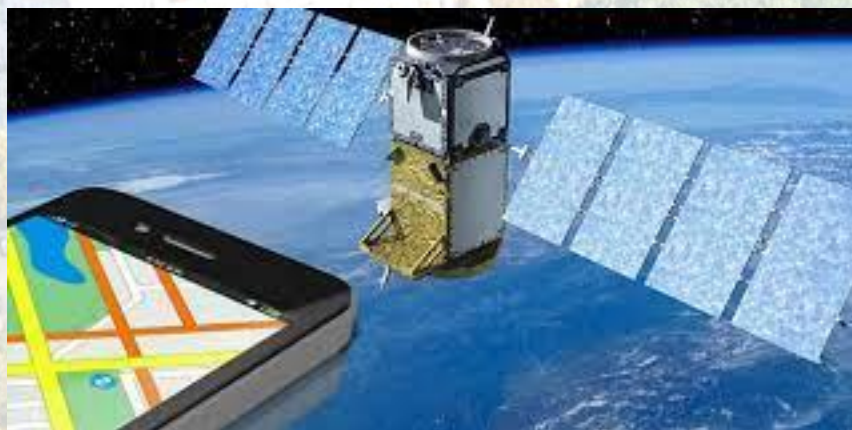
День супутникового моніторингу та навігації