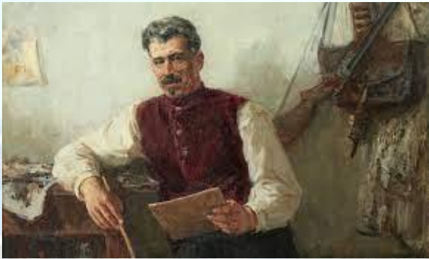
Художник – баталіст Митрофан Греков (1882-1934)