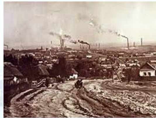
С. Кам'янське одержало статус міста (1917)