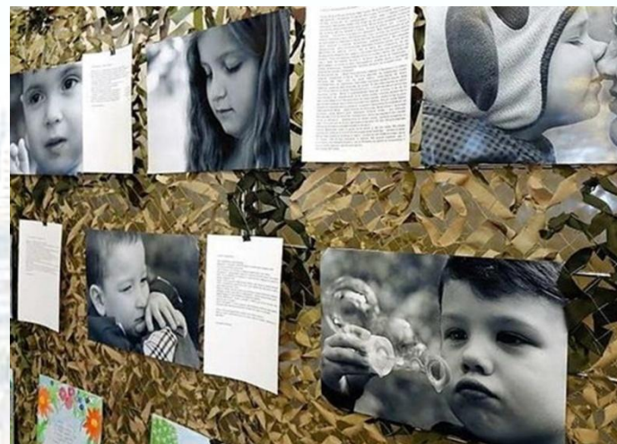
День вшанування пам'яті дітей, які загинули внаслідок збройної агресії російської федерації проти України