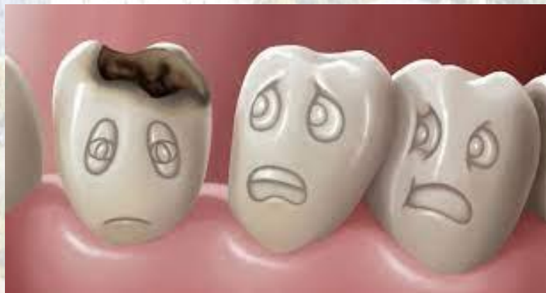
Всесвітній день боротьби з карієсом