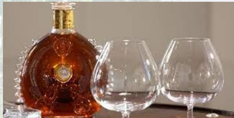
Національний день коньяку (США)