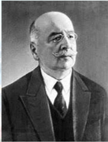
Мікробіолог, генетик, професор Георгій Надсон (1867-1939)