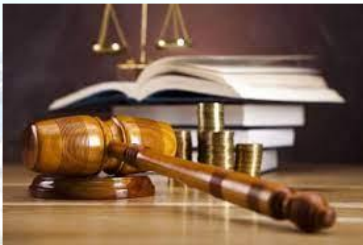
День Господарських судів України