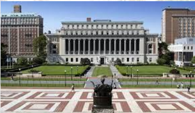
В Колумбійському університеті (США, Нью-Йорк) вперше вручили Пулітцерівську премію (1917)