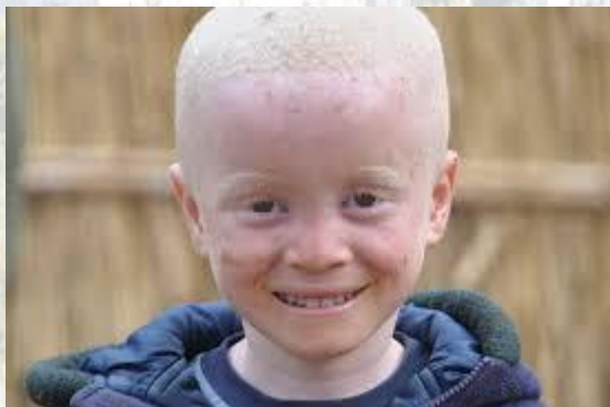
Міжнародний день поширення інформації про альбінізм