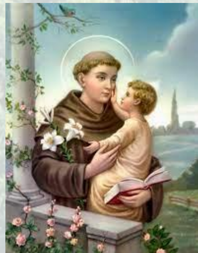
День святого Антонія - покровителя закоханих, тварин і всіх зневірених