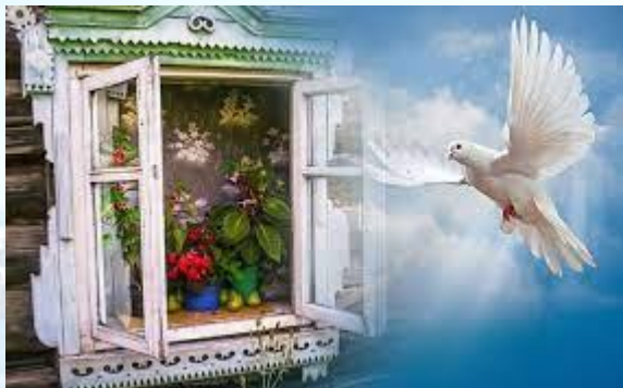
День Святого Духа