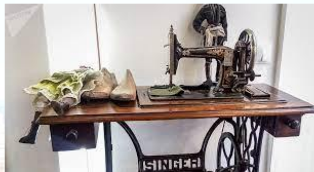
День швейної машинки