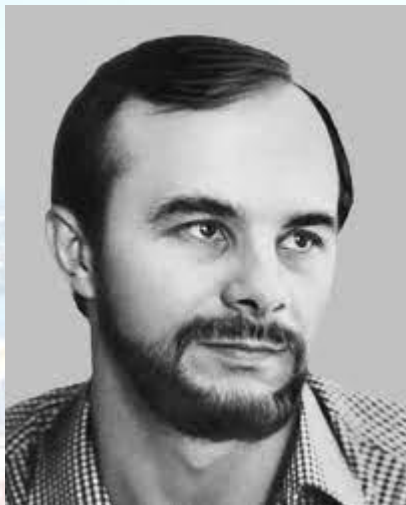
Поет, журналіст, перекладач Василь Моруга (1947)