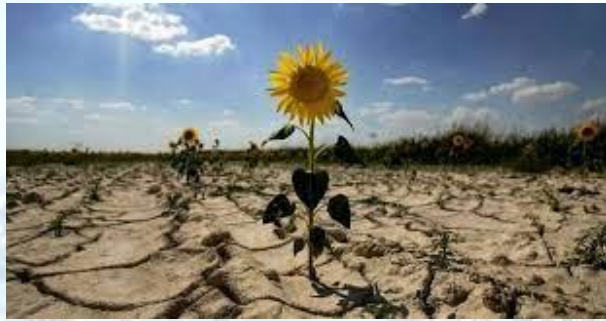
Всесвітній день боротьби з опустелюванням і посухою