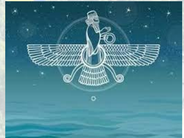
Свято целителів Хаурват (зороастризм)