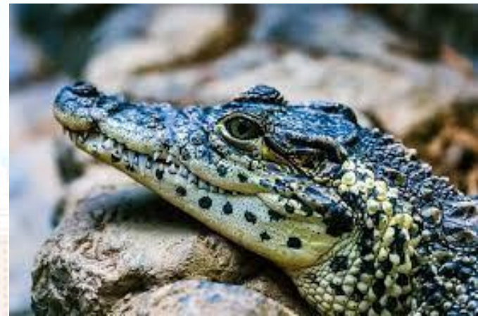
Всесвітній день крокодила