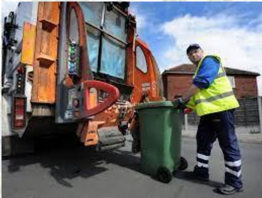
Всесвітній день сміттяра