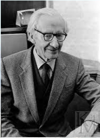
Економіст, Нобелівський лауреат 1977 року Джеймс Мід (Англія, 1907-1995)