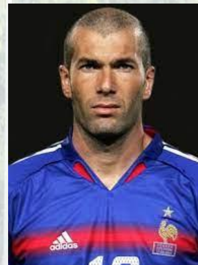
Футболіст, чемпіон світу 1998 року, тренер Зінедін Зідан (Франція, 1972)