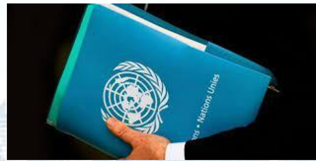
День державної служби ООН