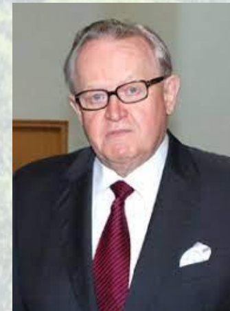
Президент Фінляндії, дипломат, Нобелівський лауреат 2008 року Мартті Ахтісаарі (1937)