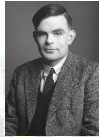
Математик, логік і криптограф, розробник перших обчислювальних машин, його роботи послужили основою для створення сучасних ЕОМ Алан Тюрінг (Англія, 1912- 1954)