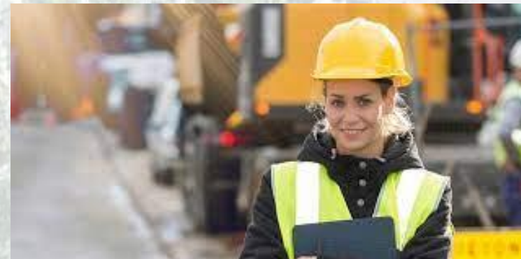
Міжнародний день жінок в інженерії