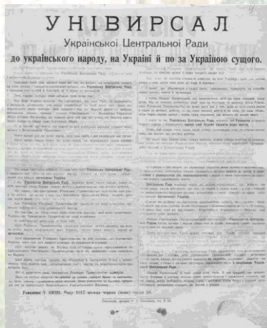
Центральна Рада ухвалила I Універсал, яким проголошено автономію України (1917)