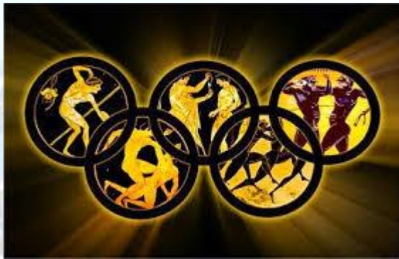
Міжнародний олімпійський день