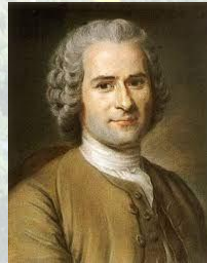
Письменник і мислитель епохи Просвітництва Жан-Жак Руссо (Франція, 1712-1778)