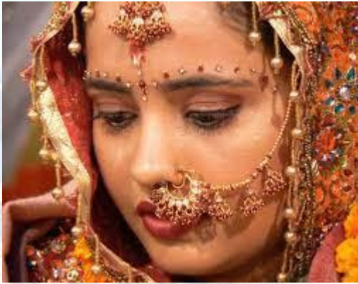
Міжнародний день пірсингу