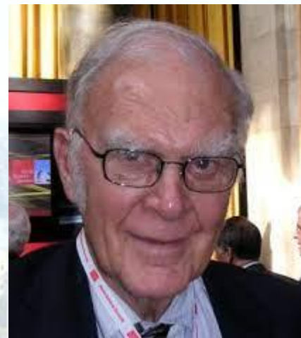
Хімік, Нобелівський лауреат 1995 року Шервуд Роуланд (США, 1927-2012)