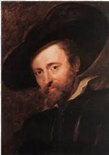
Писець Пітер Рубенс (Нідерланди, 1577-1640)