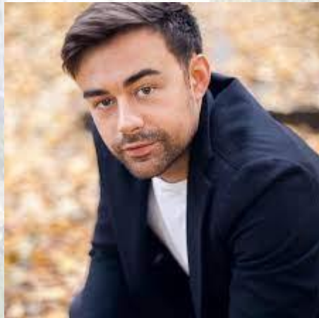
Актор театру та кіно Владислав Никитюк (1992)