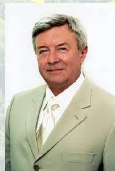
Оториноларинголог, професор Олег Дюмін (1937)