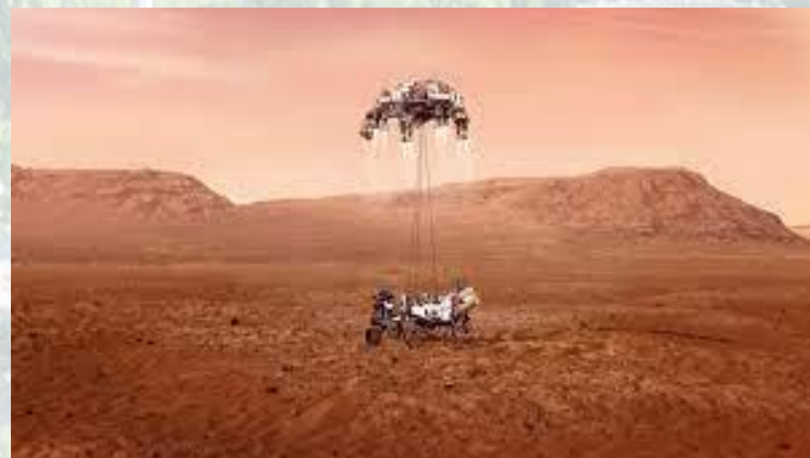
На Марс зробив посадку американський апарат «Pathfinder» (1997)