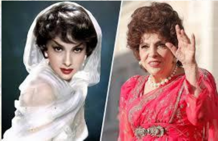
Кіноакторка, секс-символ свого часу Джина Лоллобріджиди (Італія, 1927)