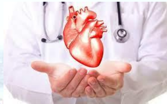
Всесвітній день кардіолога