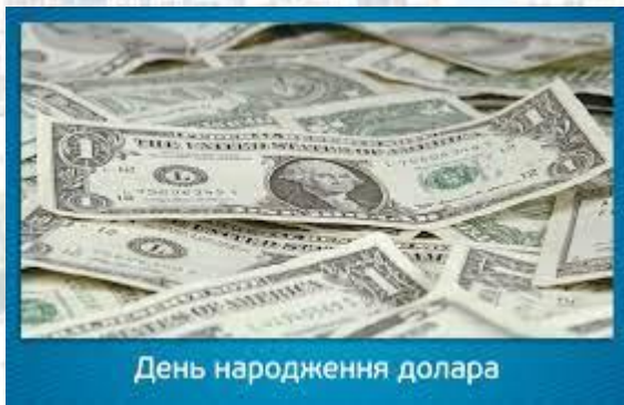
День народження долара