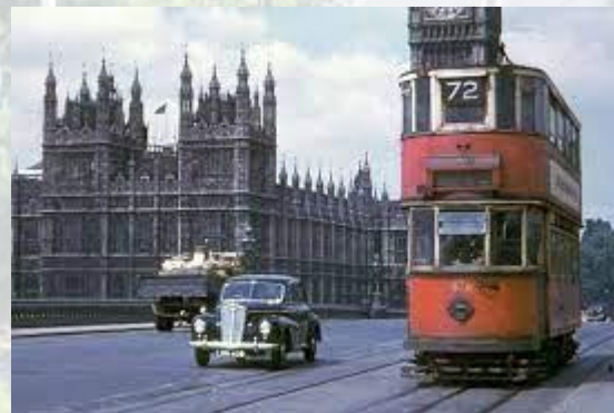
У Лондоні востаннє проїхав трамвай (1952)