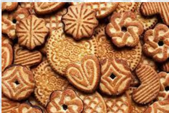
День цукрового печива