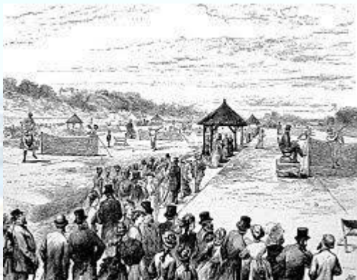
Перший фінал тенісного турніру у Вімблдоні, переможцем став Спенсер Гір (Англія, 1877)