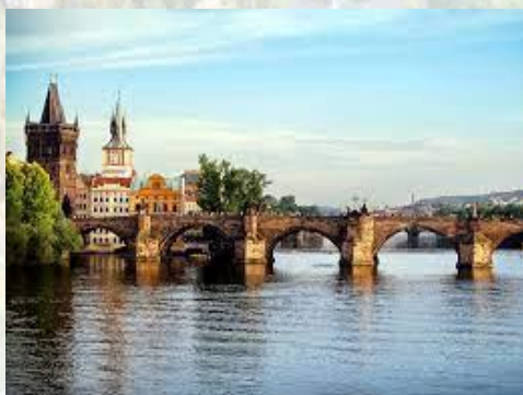
Король Карл IV заклав в Празі Карлов міст через Влтаву (Чехія, 1357)