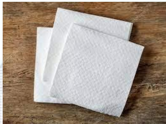
Англійський фабрикант паперу Джон Дікінсон на щорічній зустрічі виробників паперу представив на урочистому обіді перші паперові серветки (1887)