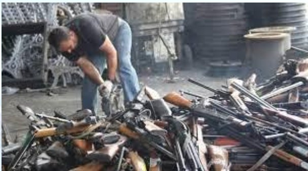
Міжнародний день знищення зброї