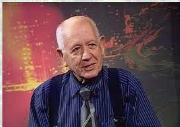
Фахівець з кінематографічних спецефектів, аніматор, лауреат премії «Оскар» Євген Мамут (Україна, США, 1942)