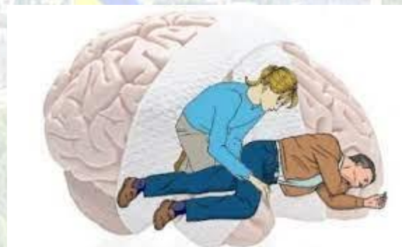
День обізнаності про черепно-мозкові травми (США)