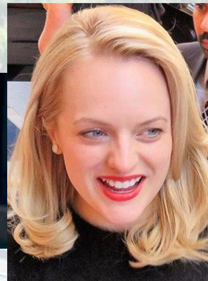
Акторка театру, кіно й телебачення, продюсерка Елізабет Мосс (США, 1982)