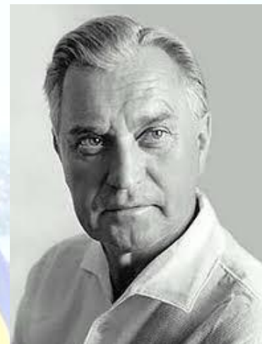
Актор театру і кіно Микола Гриценко (1912-1979)