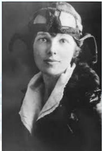
Письменниця і пілот; перша жінка-пілот, яка перелетіла через Атлантичний океан Амелія Ергарт (США, 1897-19437)