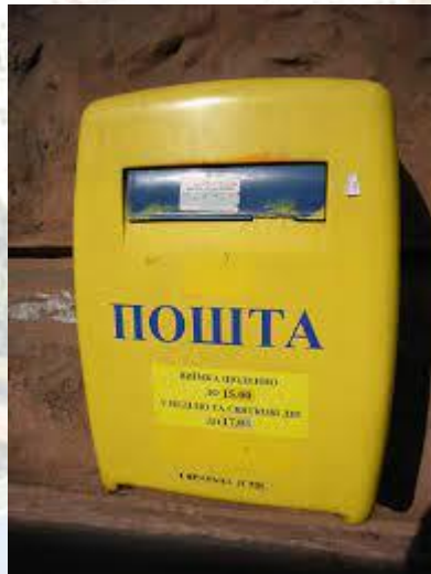
День народження поштової скриньки