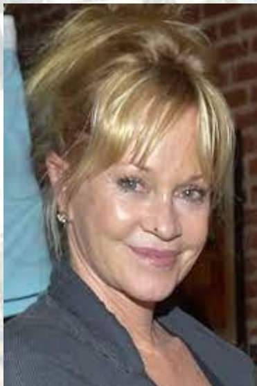
Кіноактриса Мелані Гріффіт (США, 1957)