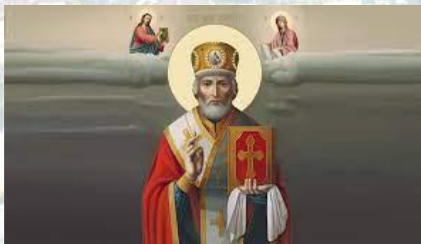
Різдво Миколи Чудотворця