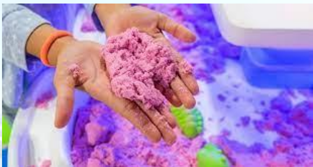
Міжнародний день кінетичного піску