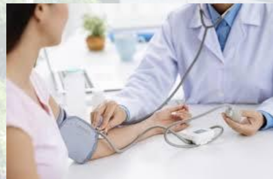
День щорічного медичного огляду (США)