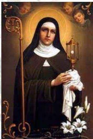
День святої Клари - покровительки телебачення