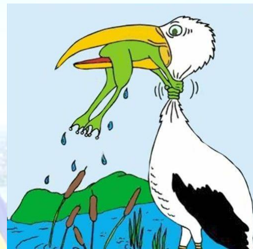
День «Ніколи не здавайся»