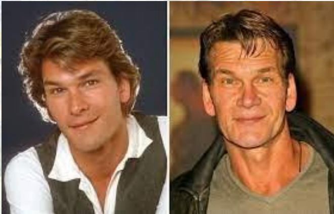
Актор Патрік Свейзі (США, 1952-2009)