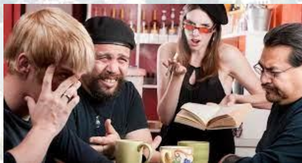
День поганої поезії