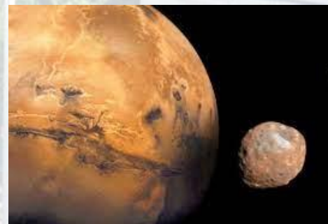
Астроном Асаф Холл відкрив супутник Марса - Фобос (США, 1877)