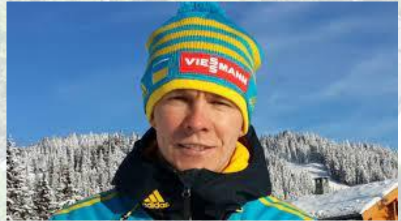
Дворазовий призер чемпіонатів світу з біатлону Андрій Дериземля (1977)