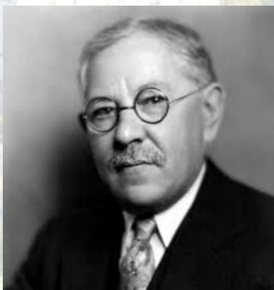
Парфюмер, засновник косметичної компанії «Макс Фактор» Макс Фактор (США, 1872-1938)