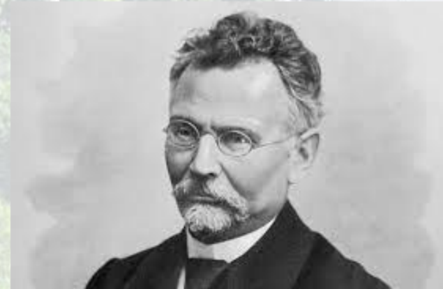
Письменник Болеслав Прус (Польща, 1847-1912)