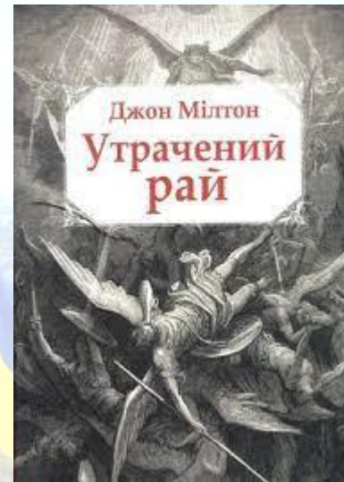
Опублікована епічна поема Джона Мільтона «Втрачений рай» (1667)