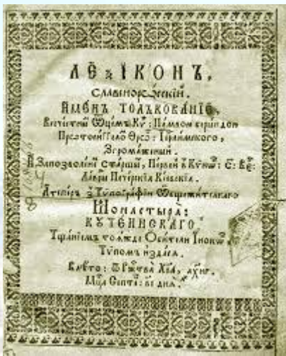
Вийшов перший словник української мови «Лексіконъ славенноросскій і именъ тълкованіє» Памви Беринди (1627)