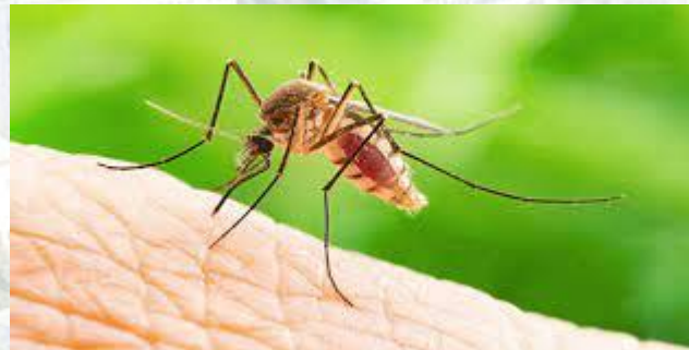
Всесвітній день москітів (комарів)