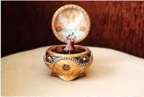
День музичних шкатулок