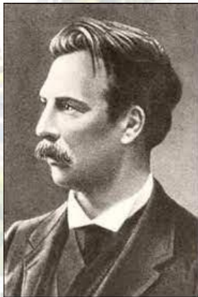
Письменник Шарль Де Костер (Бельгія, 1827-1879)