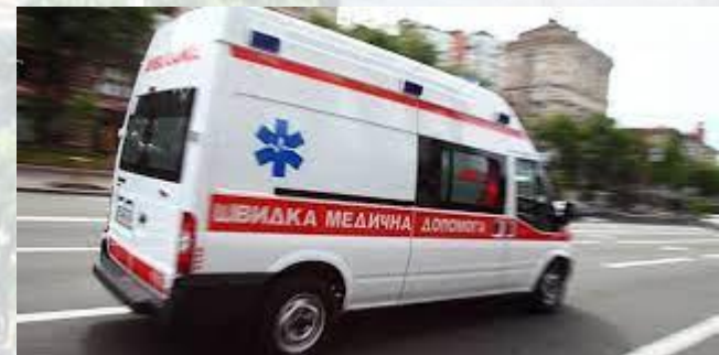
Міжнародний день медичного транспорту