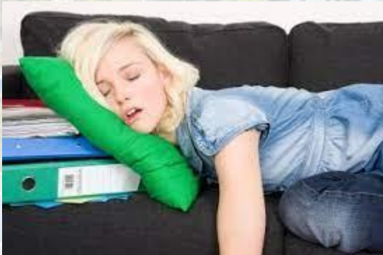
Всесвітній день ліні