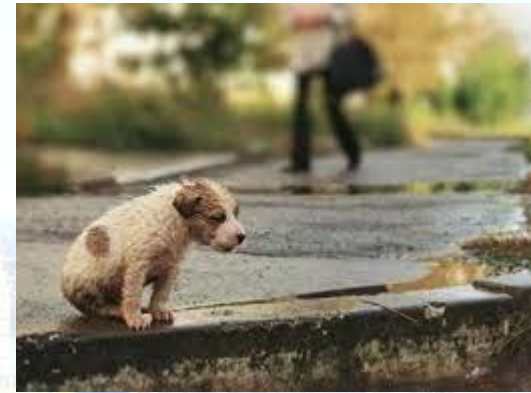
Всесвітній день бездомних тварин