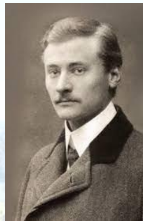
Вчений, винахідник, один з піонерів ракетної техніки Фрідріх Цандер (1887-1933)