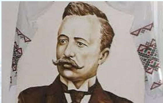
Поет, прозаїк та громадсько-політичний діяч Осип Маковей (1867-1925)