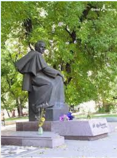
У Дніпрі відкрито пам'ятник молодому Тарасу Шевченку (1992)