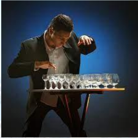
Міжнародний день дивної музики