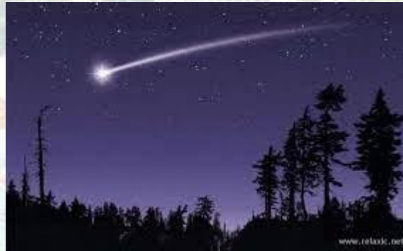
День падаючої зірки