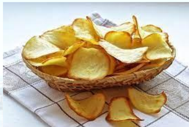
День народження картопляних чипсів