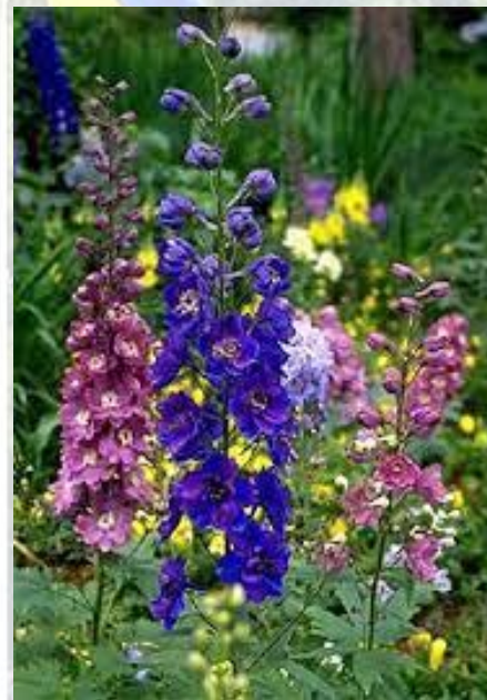
Дельфіміум (кельтський гороскоп, 24.08-02.09)