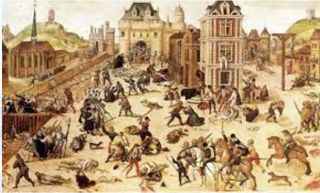
Варфоломіївська ніч, бійня протестантів-гугенотів католиками у Франції (1572)