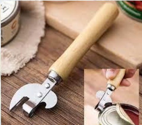
День консервного ножа