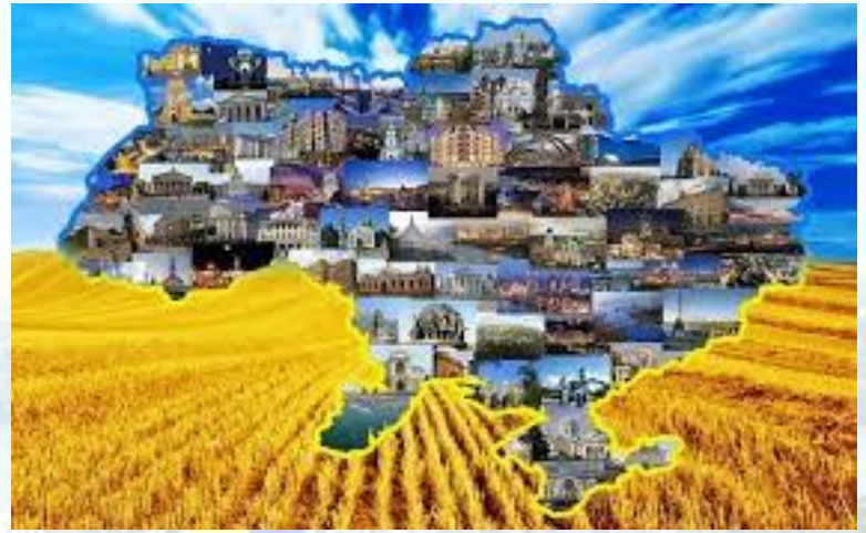
День Незалежності України