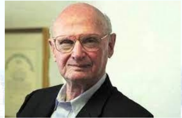
Економіст, Нобелівський лауреат 1990 року Гаррі Марковіц (США, 1927)