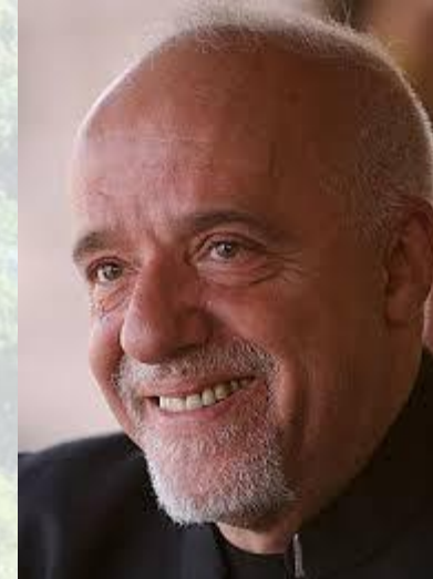
Письменник, загальний тираж книг перевищує 300 мільйонів Пауло Коельо (Бразилія, 1947)