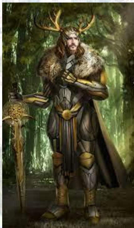
Бог Відар (гороскоп вікінгів, 24.08 – 22.09)