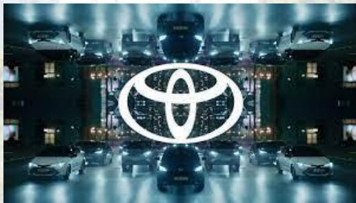
Кіічіра Тойода заснував автомобільну компанію "Тойота" (1937)