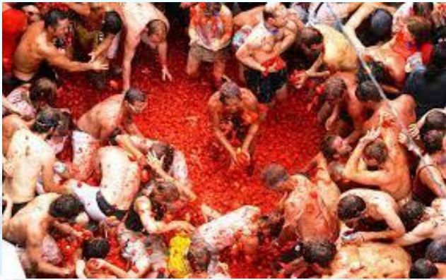
Битва томатів (Іспанія)