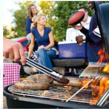
День їжі на свіжому повітрі