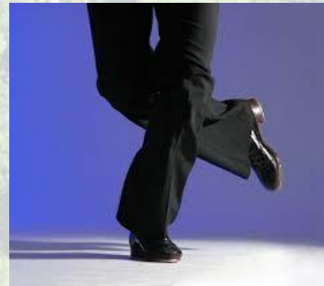
31 серпня 1997 року був встановлений новий світовий рекорд - за сім годин, танцюючи чечітку, американець Девід Мінан пройшов 45,45 км.