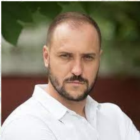
Актор театру та кіно, телеведучий, педагог Артем Позняк (1982)