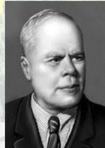
Фармаколог, професор Сергій Анічков (1892-1981)