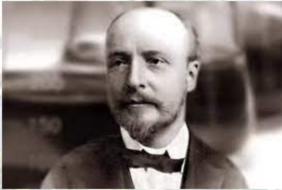
Фізик, хімік, винахідник перших термосів Джеймс Дьюар (Шотландія, 1842- 1923)