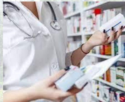
Всесвітній день фармацевта