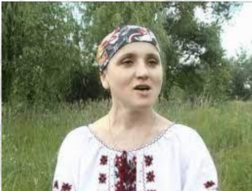
Літературознавець, письменниця і психоаналітик Ніла Зборовська (1962)