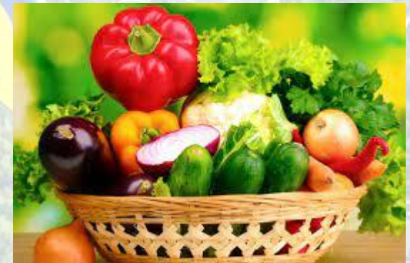
Всесвітній день без м'яса