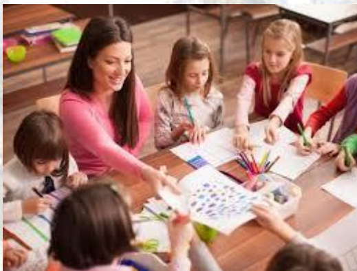
День вихователя і всіх дошкільних працівників в Україні