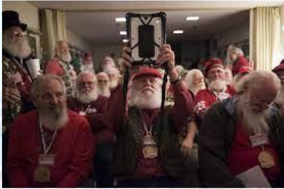
В містечку Альбїон (штат Нью-Йорк) відкрилася перша школа з навчання Санта-Клаусів (США, 1937)