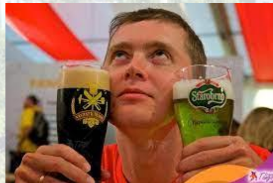
День чеського пива