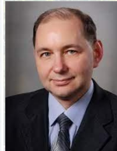
Фізіолог, фармаколог, професор Ігор Заморський (1967)