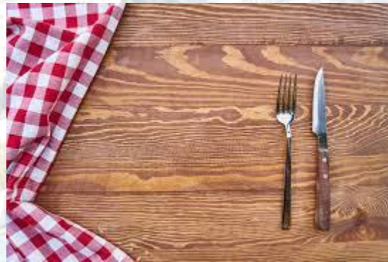
День свободи від голоду