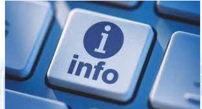
Міжнародний день права знати