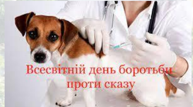
Всесвітній день боротьби проти сказу