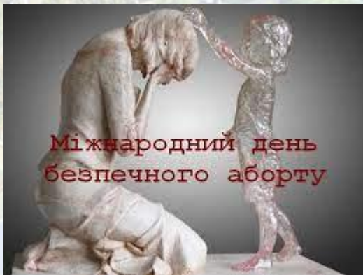
Міжнародний день безпечного аборту