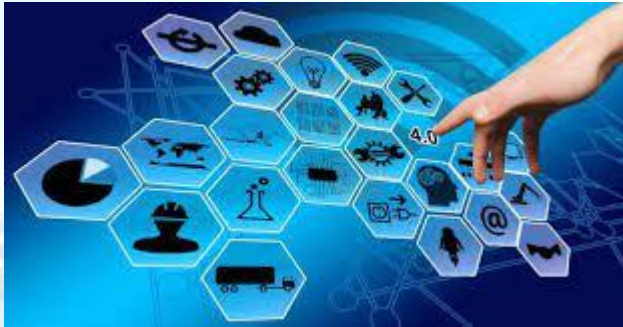
Міжнародний день загального доступу до інформації