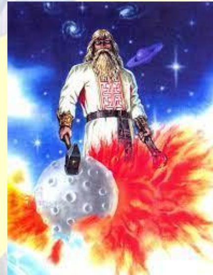
День слов'янського бога Сварога