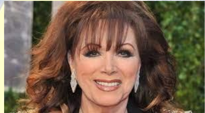
Письменниця, сценаристка, актриса Джеккі Коллінз (США, 1937-2015)