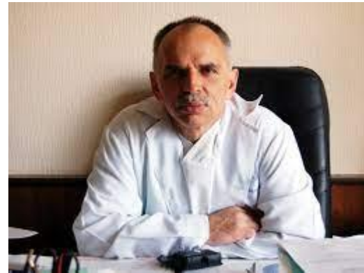
Уролог, професор Олексій Люлько (1957)