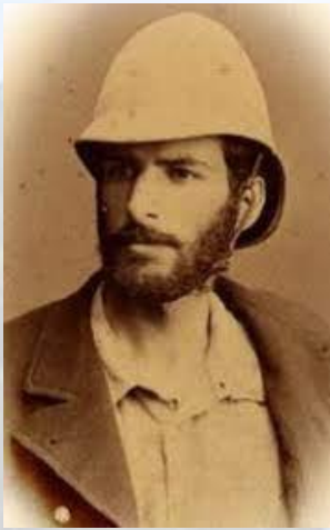
Письменник, автор пригодницьких романів Луї Буссенар (Франція, 1847-1910)