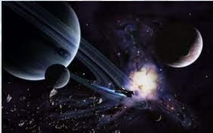
Всесвітній тиждень космосу