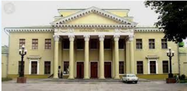
Відкрито перший в державі Палац культури студентів (Дніпро, 1952)