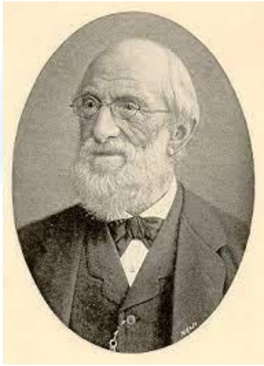
Епідеміолог, історик медицини, професор Август Хірш (1817-1894)