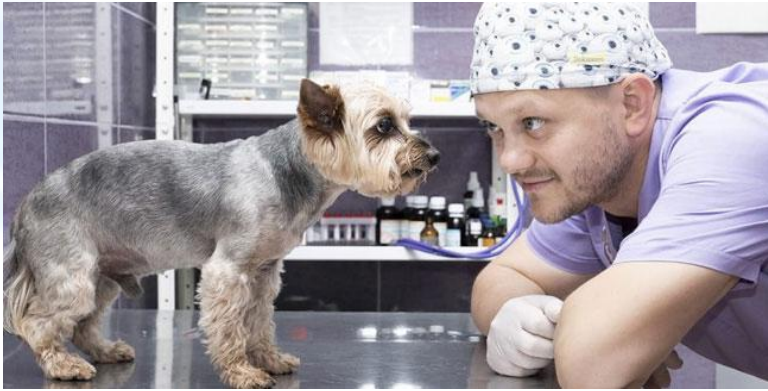
День ветеринарної служби День ветеринарної служби в системі міністерства внутрішніх справ в Україні