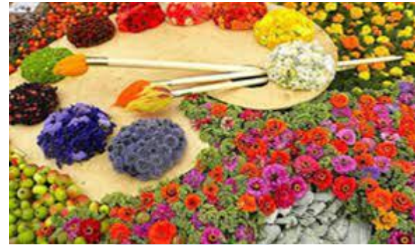
День художника України