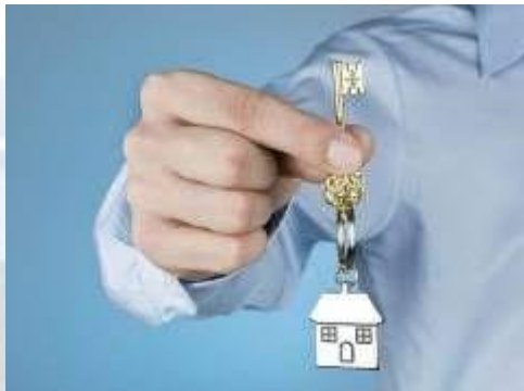
День ріелтора в Україні