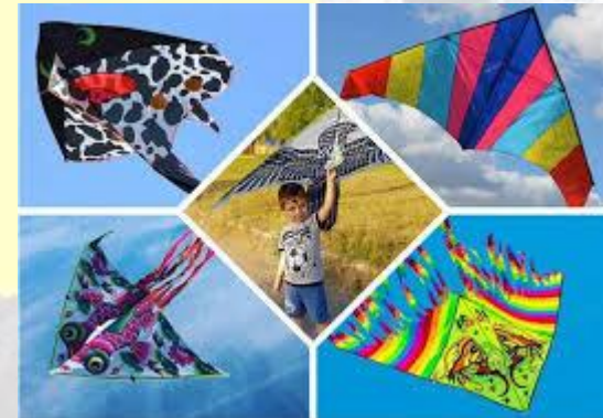
Всесвітній день повітряних зміїв