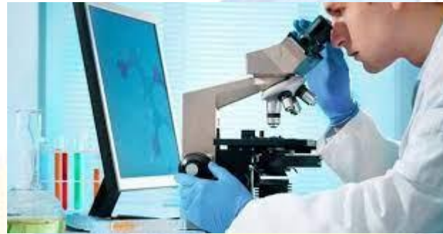
День працівників державної санітарно-епідеміологічної служби України