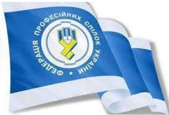
День професійних спілок України