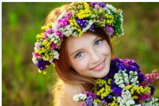
Міжнародний день дівчаток