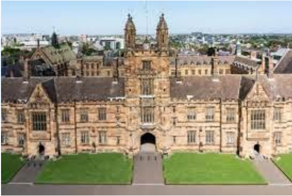
Відкрився найстаріший в Австралії Сіднейський університет (1852)