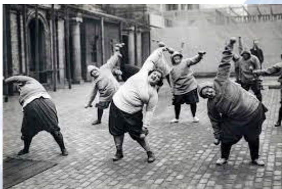
Всесвітній день боротьби з ожирінням