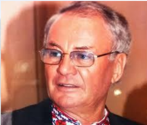
Письменник, політик, співзасновник і керівник Демократичної партії України Володимир Яворівський (1942-2021)