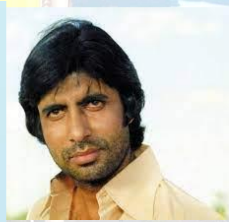
Актор, продюсер, телеведучий, політик Амітабх Баччан (Індія, 1942-