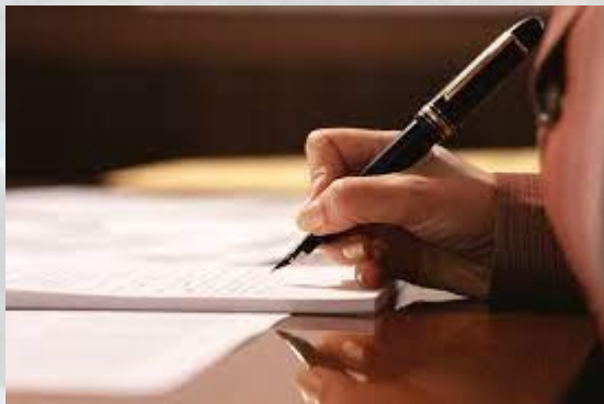
День написання листа в майбутнє