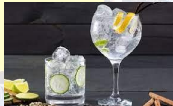
Міжнародний день джину з тоніком