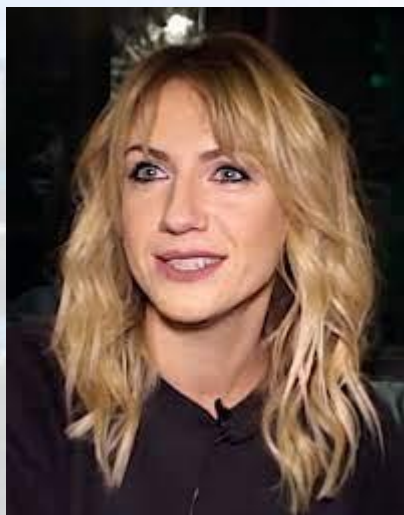
Телеведуча, блогерка Леся Нікітюк (1987)