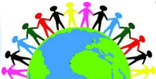
Всесвітній день гідності