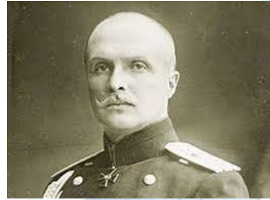
Генерал Павло Скоропадський проголошений гетьманом на з'їзді українського Вільного козацтва в Чигирині (1917)