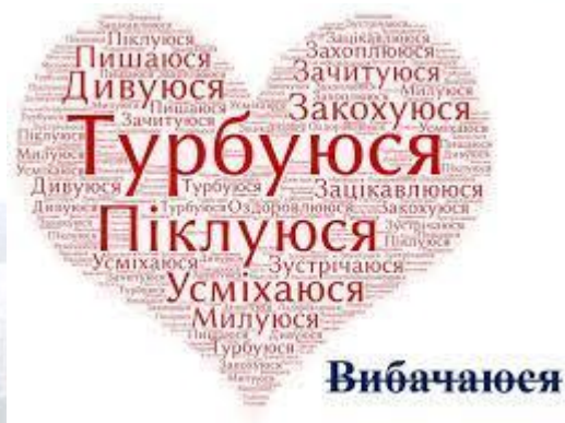
Міжнародний день займенників