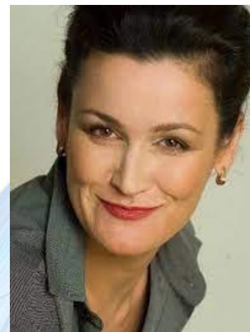
Акторка театру та кіно, телеведуча Наталія Васько (1972)