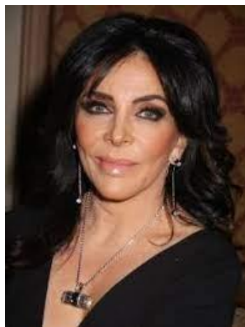
Акторка, співачка і телеведуча Вероніка Кастро (Мексика, 1952)