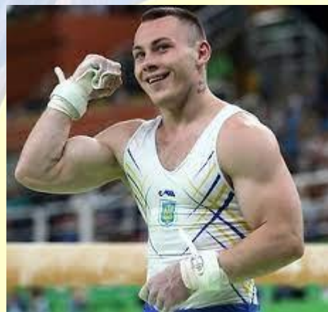
Гімнаст, багаторазовий призер чемпіонатів та Універсіад, Бронзовий призер Олімпійських ігор 2012 Ігор Радівілов (1992)