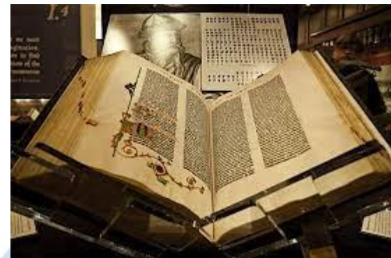
На аукціоні у Нью-Йорку перше видання Біблії Гуттенберга продане за рекордну ціну - 5,39 млн. доларів (1987)