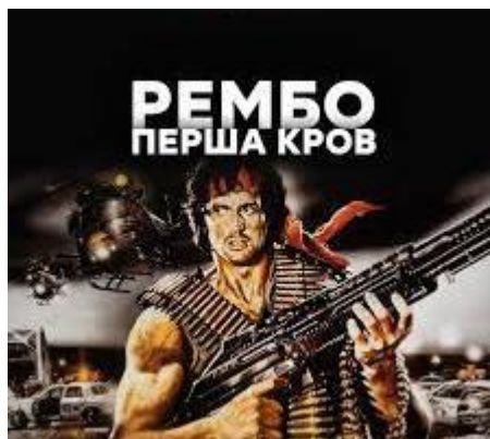
На екрани вийшов фільм «Перша кров» з Сильвестром Сталлоне у ролі Рембо (США, 1982)