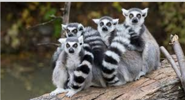
Всесвітній день лемурів