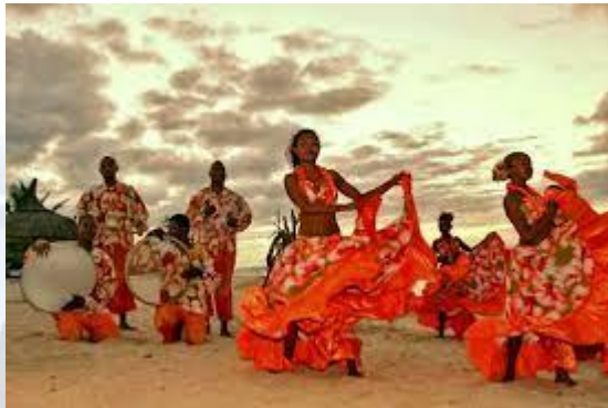
Міжнародний день креольської культури