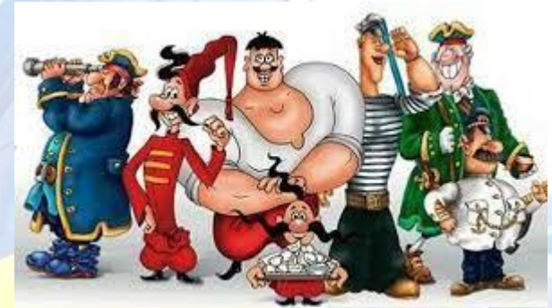
Міжнародний день анімації