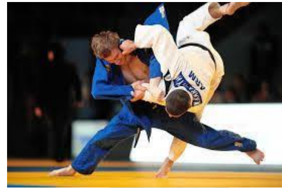
Всесвітній день дзюдо