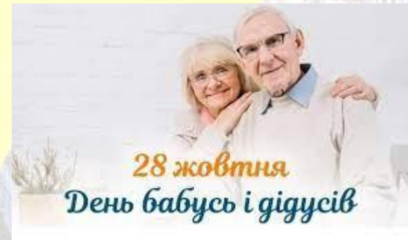
28 жовтня День бабусь і дідусів