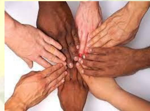
Міжнародний день боротьби проти фашизму, расизму та антисемітизму