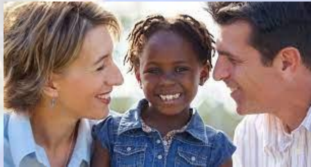
Всесвітній день усиновлення