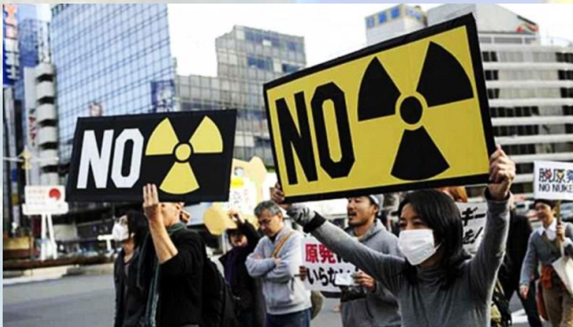
Міжнародний день антиядерних акцій