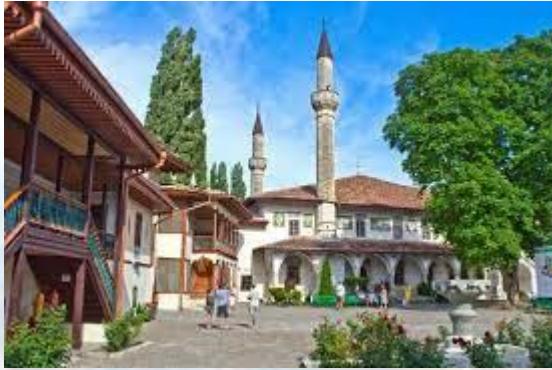
В колишньому ханському палаці у Бахчисараї відкрито Національний музей (1917)