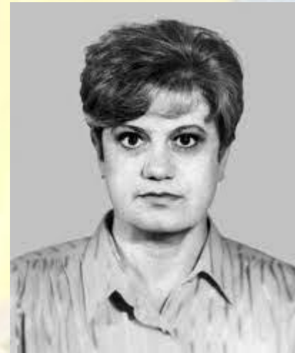
Кардіолог, професор Тетяна Іващенко (1947 – 2002)