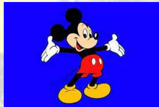
День Міккі Мауса