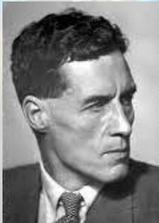
Фізик, Нобелівський лауреат 1948 року Патрік Блекетт (Англія, 1897-1974)