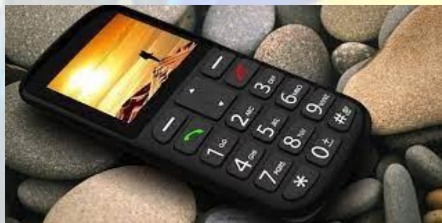
День кнопочового телефону