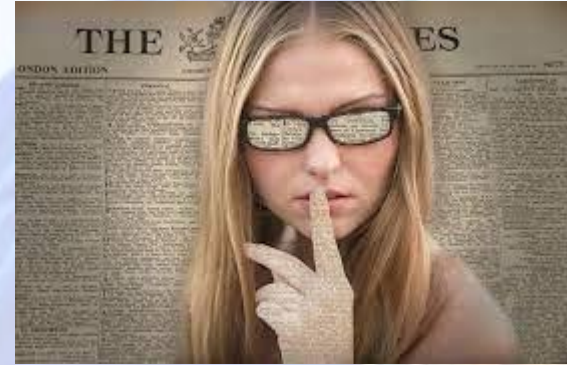
День вигадування секретів