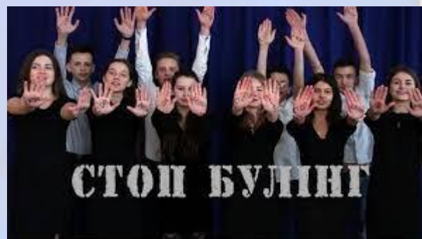
Міжнародний день протидії булінгу