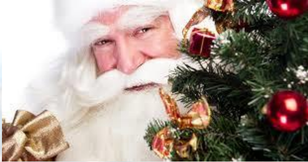
День народження Діда Мороза