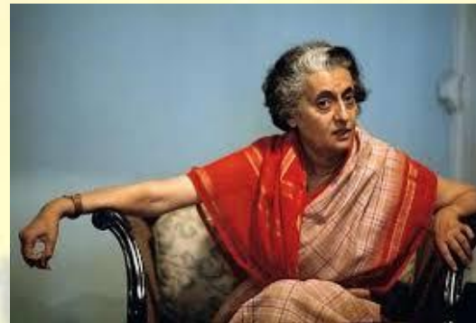
Прем'єр-міністр Індії Індіра Ганді (1917-1984)