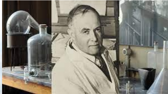
Біохімік, Нобелівський лауреат 1946 року Джеймс Самнер (США, 1887-1955)